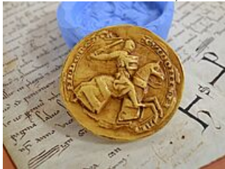
Atelier de sigillographie « Le sceau du roi », AM Mantes-la-Jolie)