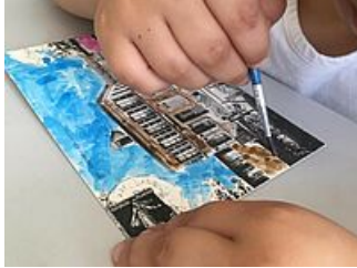
Atelier colorisation de carte postale « Bonjour de Mantes », AM Mantes-la-Jolie)