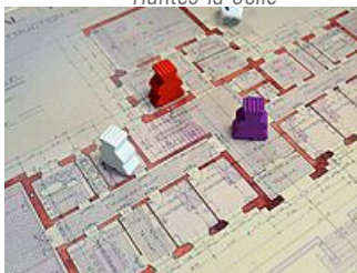
Jeu de plateau sur la citoyenneté « Aux dés, citoyen », AM Mantes- la-Jolie)