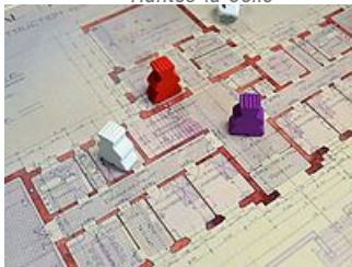
Jeu de plateau sur la citoyenneté « Aux dés, citoyen », AM Mantes- la-Jolie)