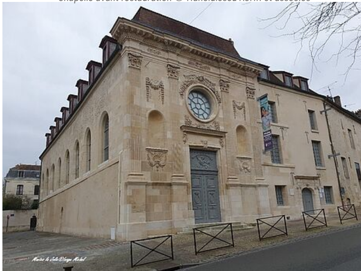
Chapelle après restauration