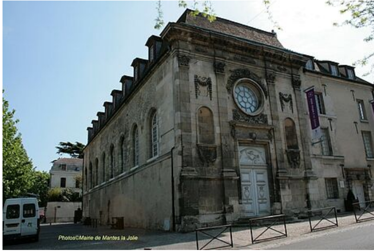
Chapelle avant restauration

Avec la Collégiale Notre-Dame voisine, c'est l'un des rares monuments qui n'a pas été détruit par les bombardements alliés du 30 mai 1944. En 1964, la chapelle de l'Hôtel-Dieu est inscrite à l'inventaire des Monuments Historiques et sa façade du XVII e siècle est classée en 1948. Aucun décor intérieur ne subsiste mais la façade témoigne encore de son âge d'or. Harmonieuse et classique, elle a conservé ses pilastres corinthiens, sa grande rosace surmontée d'une tête d'ange ailé, et ses ornements (coquilles, guirlandes...). La restauration de l'édifice achevée, le musée de l'Hôtel-Dieu est inauguré en juin 1996.