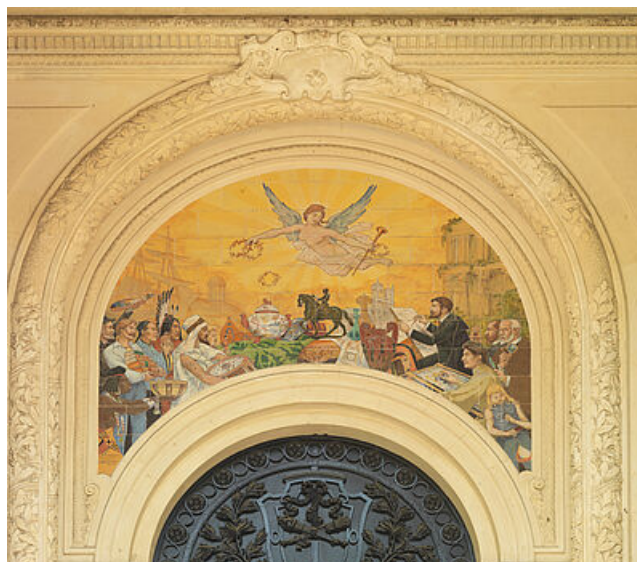
La mosaïque de A. Bonnefoy