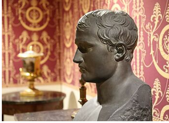
Les collections Duhamel, exposition Mantes et ses musées, musée de l'Hôtel-Dieu 2019