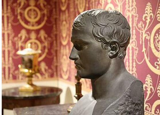
Les collections Duhamel, exposition Mantes et ses musées, musée de l'Hôtel-Dieu 2019