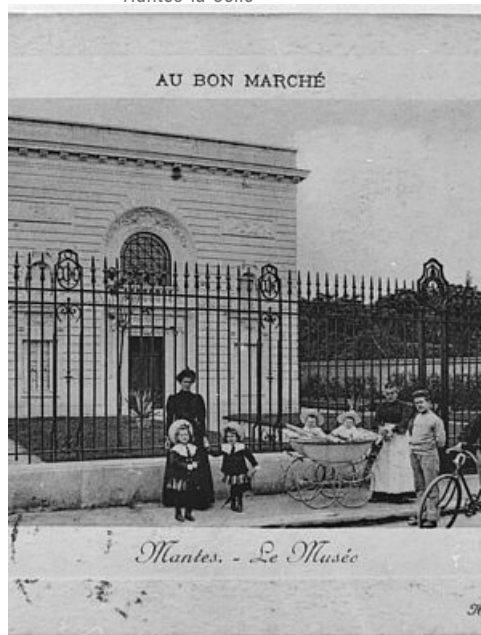
Carte postale du musée Duhamel, XIXe siècle