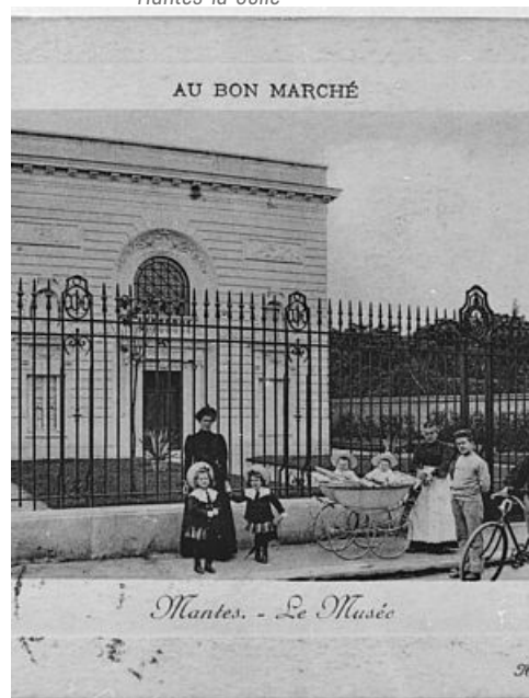
Carte postale du musée Duhamel, XIXe siècle