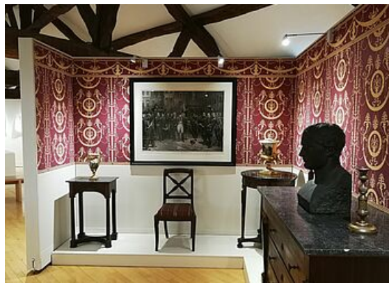
Les collections Duhamel, exposition Mantes et ses musées, musée de l'Hôtel-Dieu 2019

À l'occasion d'expositions temporaires, certaines pièces sortent des réserves.