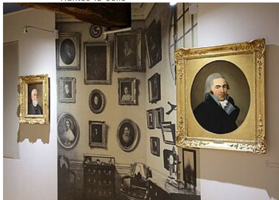
Les collections Duhamel, exposition Mantes et ses musées, musée de l'Hôtel-Dieu 2019