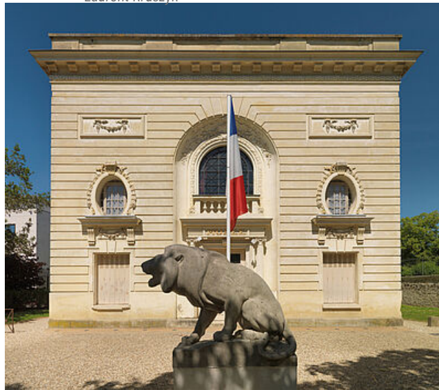
Le pavillon Duhamel côté rue L'Evesque