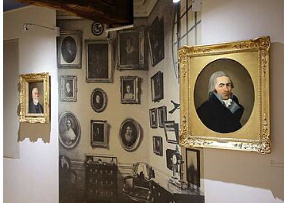
Les collections Duhamel, exposition Mantes et ses musées, musée de l'Hôtel-Dieu 2019