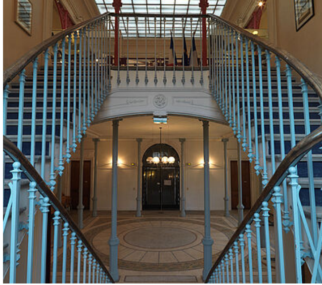
L'escalier d'honneur du pavillon Duhamel