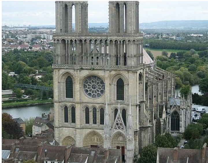
Façade de la Collégiale

Patrimoine emblématique du territoire, la Collégiale Notre-Dame domine le paysage mantais. Elle demeure le témoin vivant du passé médiéval et royal de Mantes. Sa parenté historique et architecturale avec Notre-Dame de Paris la classe parmi les plus beaux monuments d'Île-de-France.