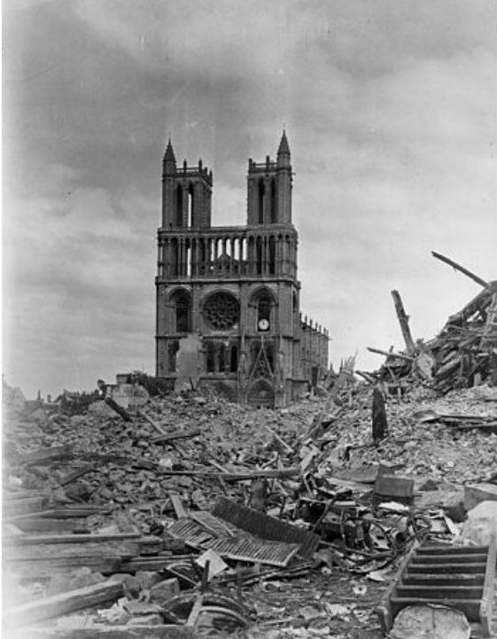
L'église sous les bombardements © R. NOEL Mantes-sur-Seine