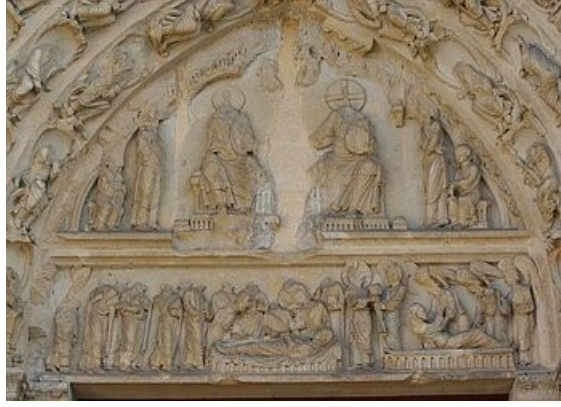
Tympan et voussures portail de la Vierge