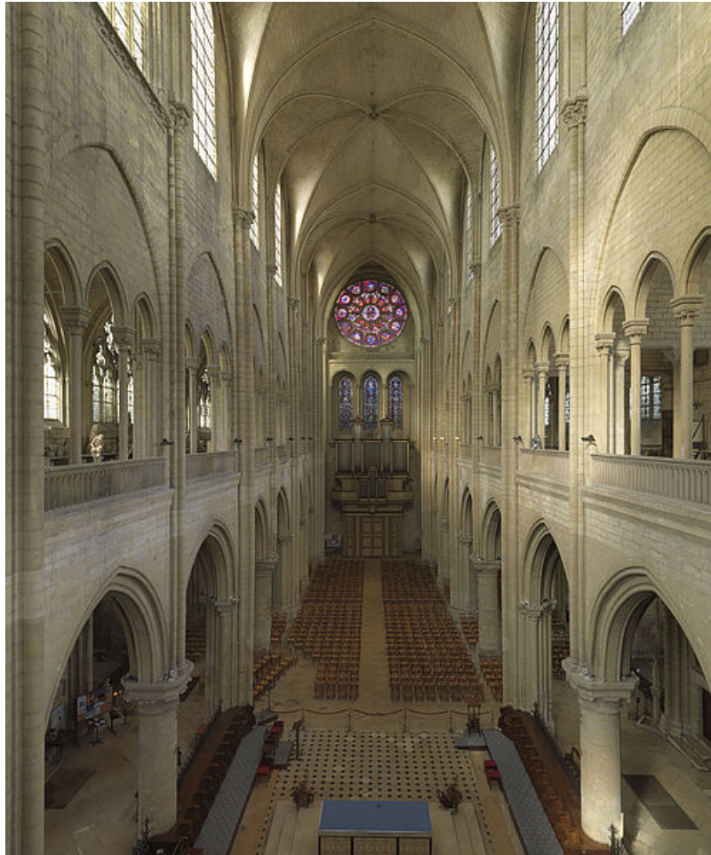
Le chevet entouré de ses chapelles rayonnantes

A l'intérieur, la nef unique, sans transept, s'ouvre sur des bas-côtés et se termine par un sanctuaire bordé de chapelles. Le déambulatoire du chœur repose sur des piliers monolithes tout à fait originaux. En lien avec la forme sexpartite des voûtes des travées de la nef, des piles fortes alternent avec des piles faibles dans l'allée centrale de l'église aujourd'hui paroissiale.