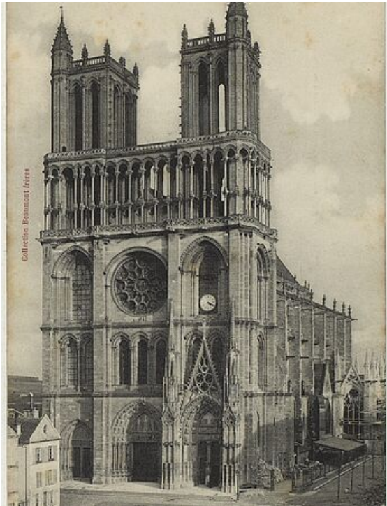
La Collégiale après restaurations

La Collégiale est régie par des abbés séculiers jusqu'en 1223, puis par un collège de chanoines, d'où son nom. Lors de la Révolution, l'édifice subit d'importantes dégradations et de nombreux pillages. Le XIX e siècle se présente comme un tournant salutaire pour la Collégiale: elle est classée au titre des Monuments historiques en 1840. L'architecte mantais Alphonse Durand (1813-1881) y mène des restaurations pendant 27 ans. De 1846 à 1873, il lui redonne son lustre et contribue à sa conservation et à sa transformation. Elle demeure aujourd'hui l'une des plus grandes églises gothiques d'Île-de-France.