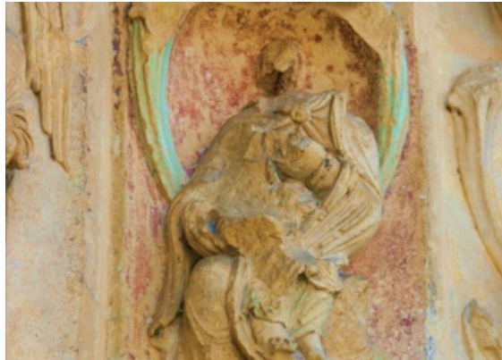
Polychromie portail de la Vierge