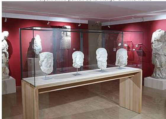
Statues et fragments, espace lapidaire au musée de l'Hôtel-Dieu