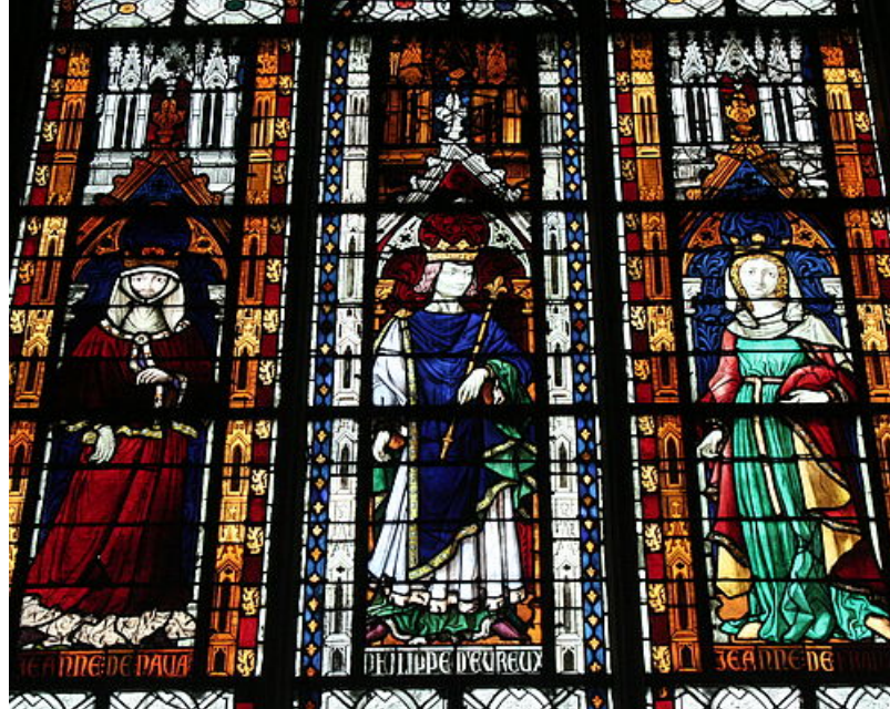
Vitrail Chapelle de Navarre