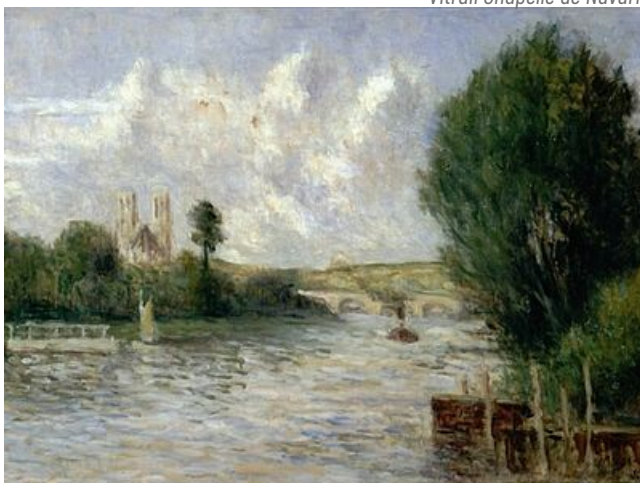
Charles Jouas, Les tours de Notre Dame de Mantes-la-Jolie, 1917, musée de l'Hôtel-Dieu