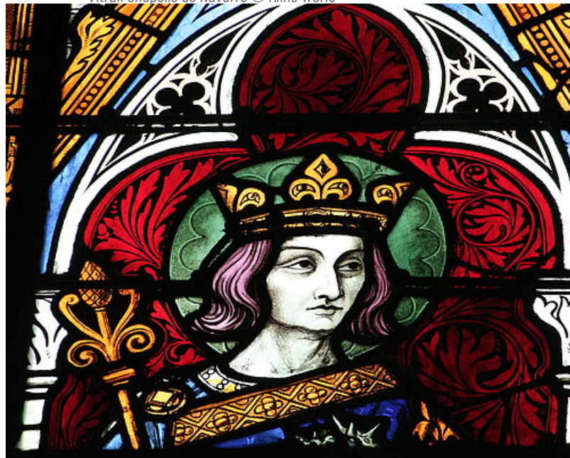
Vitrail Chapelle de Navarre - agrandissement