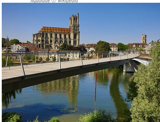
La passerelle

Les bords de Seine offrent aux Mantais un espace de promenade, de pistes cyclables, de plantations et d'aires de jeux long de près de 15 kilomètres. Embellis et protégés, ils offrent une aire de loisir et de détente exceptionnelle.