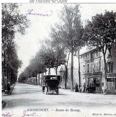
Route de Rosny, Gassicourt