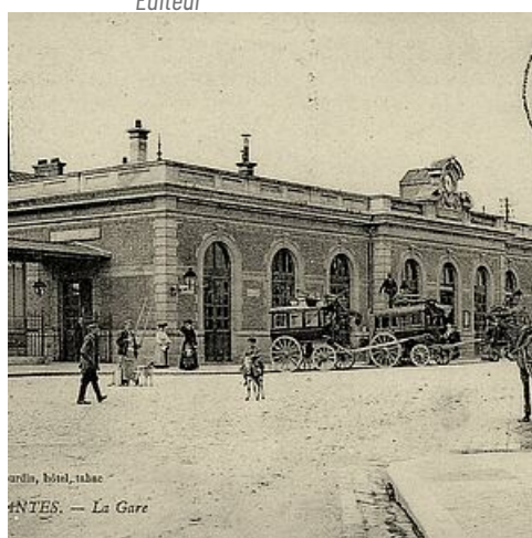
Gare de Mantes-Gassicourt, © Ville de Mantes-la-Jolie