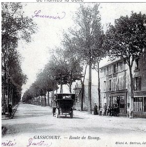
Route de Rosny, Gassicourt