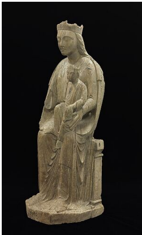
Vierge à l'enfant, début XIIIe, musée de l'Hôtel-Dieu

Plus d'informations dans la rubrique « Musée de l'Hôtel-Dieu ».