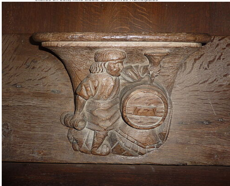
Détail de sculpture, le mois d'octobre, le tonneau de vin