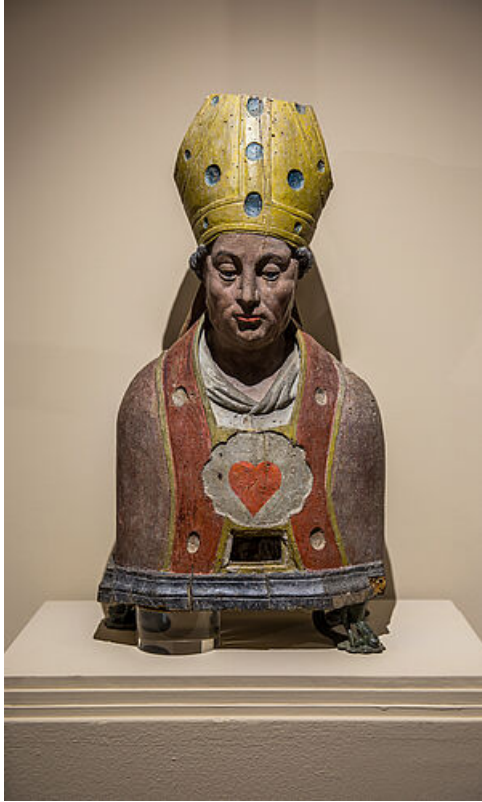
Buste reliquaire de Saint-Eloi, XVIIe siècle, musée de l'Hôtel-Dieu