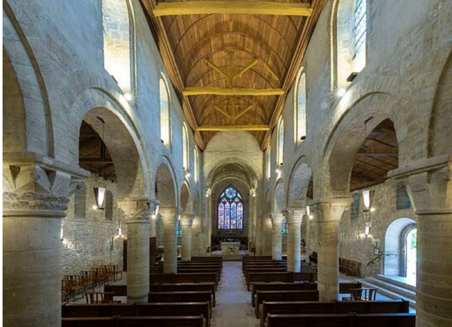
Vue d'ensemble de l'intérieur