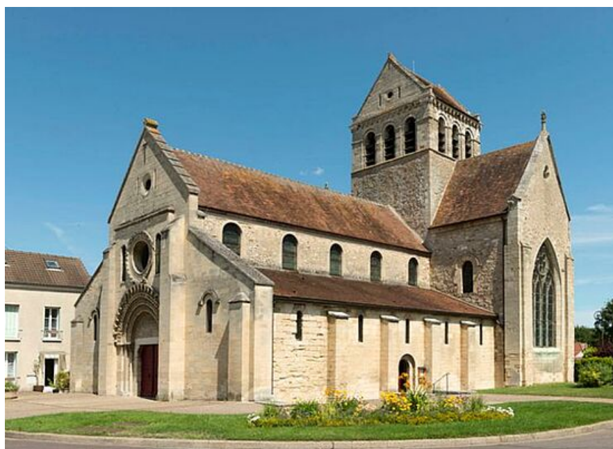
Vue d'ensemble de l'église

En 1738, l'église, les bâtiments, et les terres sont achetées par François de Sénozan, seigneur de Rosny. L'église devient alors paroissiale et le prieuré est détruit deux ans plus tard. Après la Révolution, elle appartient brièvement à Talleyrand. En parallèle du classement au titre des Monuments Historiques en 1862, des travaux de restauration sont entrepris. Alphonse Durand (1813-1881), architecte mantais ayant fait ses preuves à la Collégiale, est mandaté par la Commission des Monuments Historiques. Entre 1851 et 1862, il restaure le portail et le clocher, puis il dégage l'édifice des autres bâtiments entre 1872 et 1877.