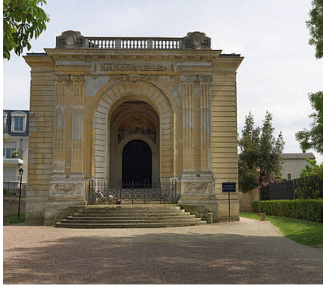
Le pavillon Duhamel côté square Briusset Bourgeois