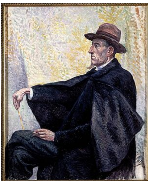
Maximilien Luce, Portrait de Félix Fénéon

En effet, Luce s'installe en 1921 à Rolleboise, à quelques kilomètres de Mantes-la-Jolie. Il y trouve un apaisement et s'intègre dans la lignée des artistes charmés par la Seine et ses motifs. Après tout, nous ne sommes qu'à quelques kilomètres de Giverny et de la demeure de Claude Monet.