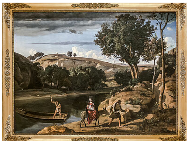
Jean-Baptiste Camille Corot, La Fuite en Egypte

Tout au long de l'année, le musée organise des expositions temporaires. Elles sont l'occasion d'approfondir nos connaissances sur les collections du musée et de faire découvrir au visiteur l'histoire et le contexte mantais d'hier et aujourd'hui.