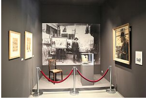
Cabinet des arts graphiques © Mantes-la-Jolie