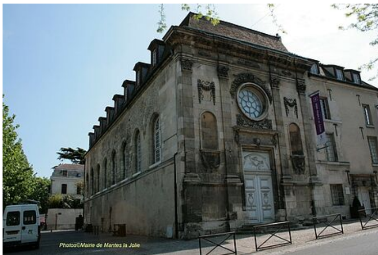
Chapelle avant restauration

Avec la Collégiale Notre-Dame voisine, c'est l'un des rares monuments qui n'a pas été détruit par les bombardements alliés du 30 mai 1944. En 1964, la chapelle de l'Hôtel-Dieu est inscrite à l'inventaire des Monuments Historiques et sa façade du XVII e siècle est classée en 1948. Aucun décor intérieur ne subsiste mais la façade témoigne encore de son âge d'or. Harmonieuse et classique, elle a conservé ses pilastres corinthiens, sa grande rosace surmontée d'une tête d'ange ailé, et ses ornements (coquilles, guirlandes...). La restauration de l'édifice achevée, le musée de l'Hôtel-Dieu est inauguré en juin 1996.