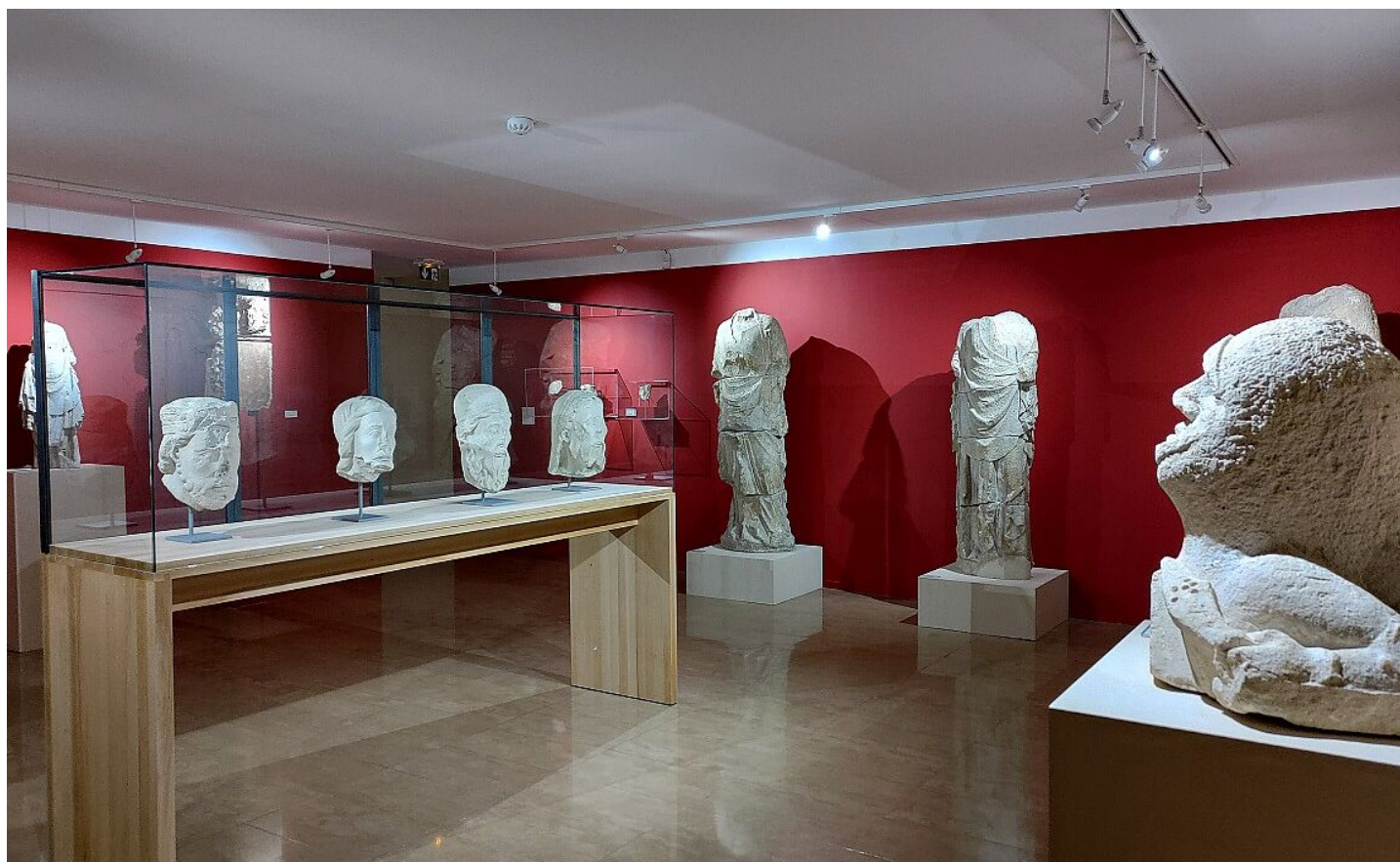
Collection médiévale, Musée de l'Hôtel-Dieu

. Cet ensemble témoigne de la haute qualité de la production artistique et artisanale régionale.