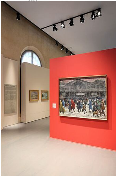
Collection Maximilien Luce

Découvrez les collections de votre musée sur POP ( https://www.pop.culture.gouv.fr/advanced-search/list/joconde?gb=%5B%7B%22field%22%3A%5B%22MUSEO.keyword%22%5D%2C%22operator%22%3A%22%2A%22%2C%22value%22%3A%22M0389%22%2C%22combinator%22%3A%22AND%22%2C%22index%22%3A0%7D%5D )