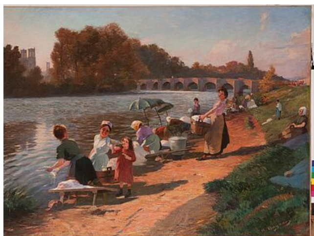
Albert Dagnaux, Les lavandières, 1906