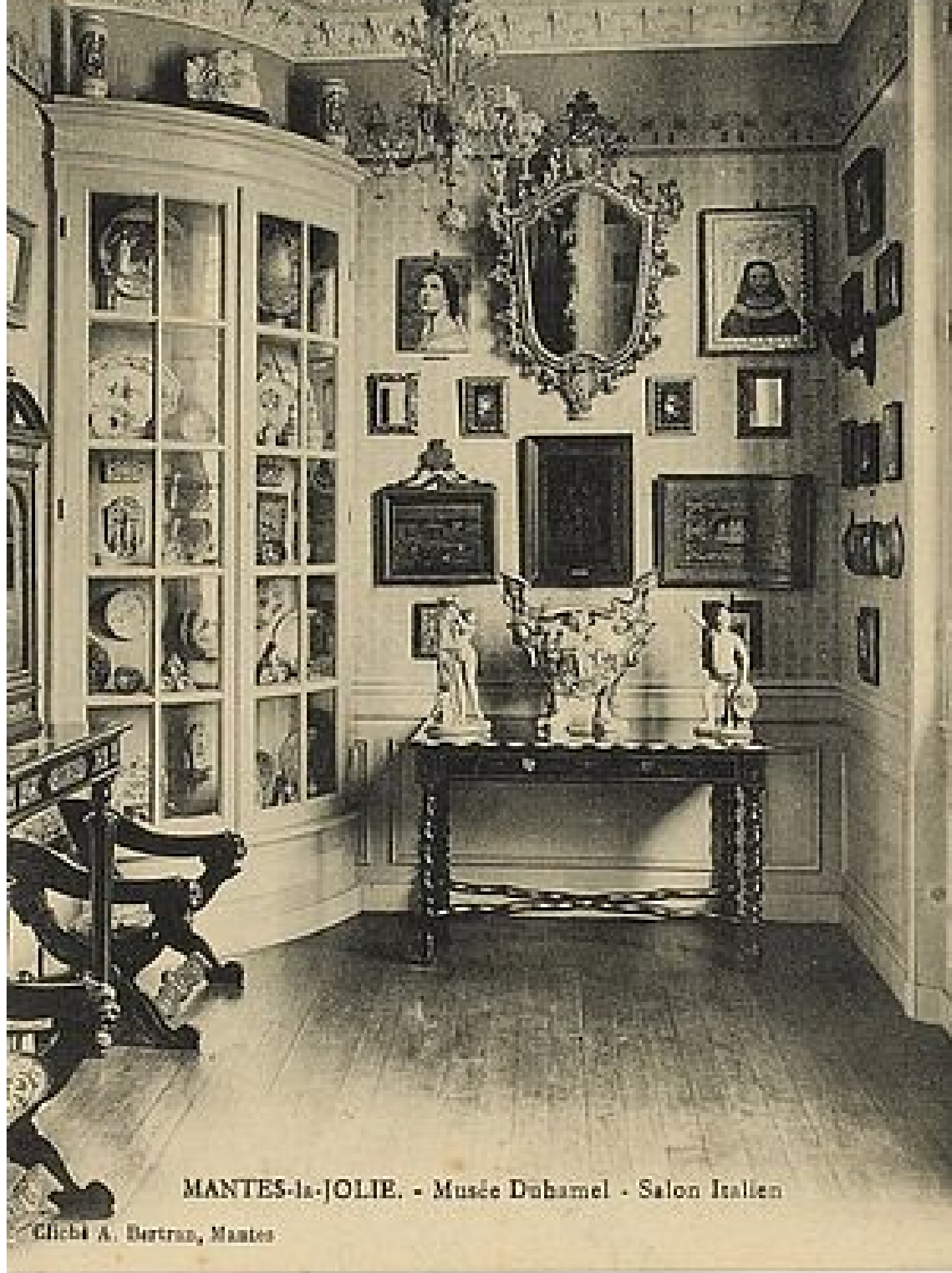
MANTES-la-JOLIE. - Musée Duhamel - Salon Italien