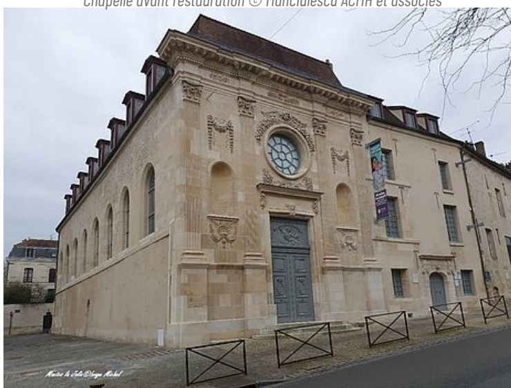
Chapelle après restauration