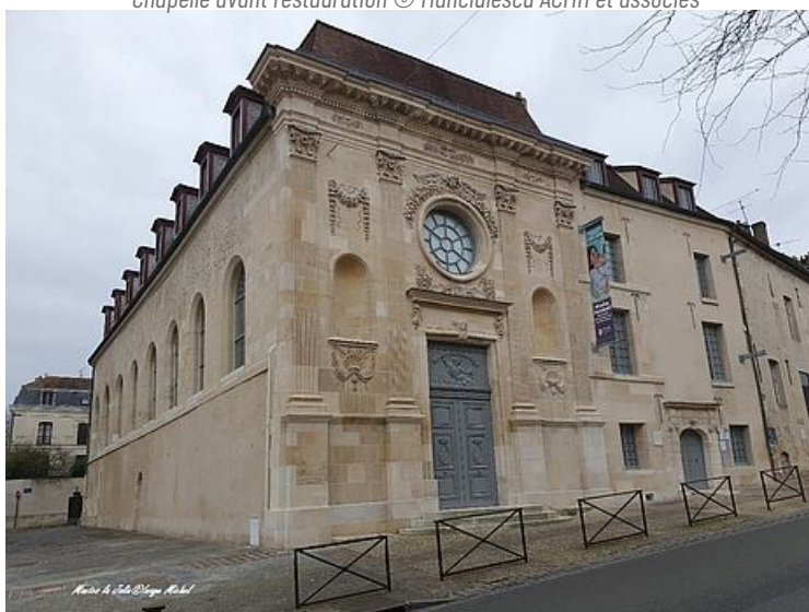
Chapelle après restauration © Mantes-la-Jolie © Michel POTREL