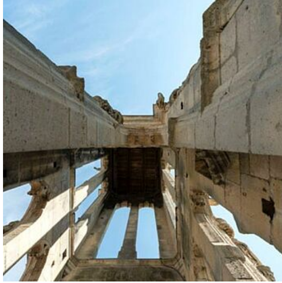
La Tour Saint-Maclou