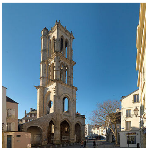
Maugendre, La tour et la place Saint-Maclou, 1852

Une première église existe au même emplacement dès 1015, mais elle est détruite lors du sac de la ville mené par Guillaume le Conquérant en 1087. Elle est reconstruite entre 1340-1344 mais la foudre s'abat sur elle et anéantit une partie de la nef puis du chœur en 1692. La reconstruction est entreprise l'année suivante. À cause d'orages et du manque d'entretien, l'église connaît encore plusieurs transformations au cours du XVIIIe. La Révolution continue de bouleverser son architecture puisque l'église devient un bien national. En 1793, le chevet est détruit pour élargir la place du marché. Philibert Alexandre et Simon Le Vieil achètent l'église pour la transformer en halle aux grains couverte et en marché aux veaux. En 1806, l'église est démolie mais heureusement la tour-clocher, ouvrage d'art jugé remarquable, est conservée. Elle est classée 100 ans plus tard, le 18 mai 1908.