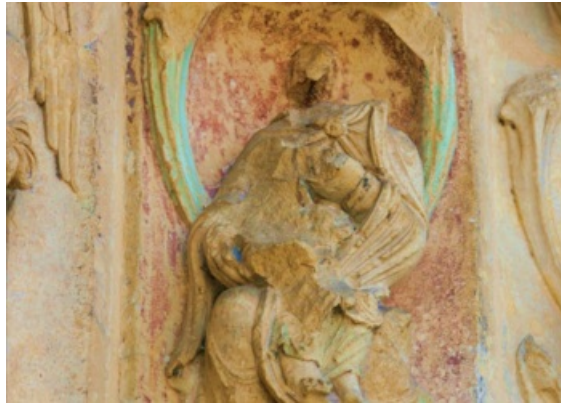
Polychromie portail de la Vierge