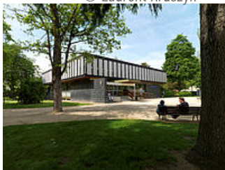
Bibliothèque G. Duhamel