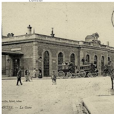
Gare de Mantes-Gassicourt