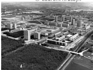
Construction du Val Fourré