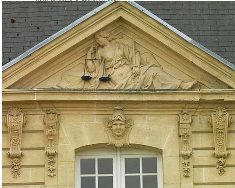
Hôtel de Mornay - Le fronton est orné de la figure allégorique de la justice.