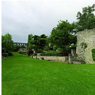
Ravelin Square Gabrielle d'Estrées

Mantes-la-Jolie conserve encore une partie de ses remparts, notamment la porte au Prêtre, et plusieurs monuments remarquables, tels que la Collégiale Notre-Dame, l'Église Sainte-Anne de Gassicourt ou encore le vieux pont de Mantes (XIe siècle), immortalisé par le peintre Jean-Baptiste Camille Corot.