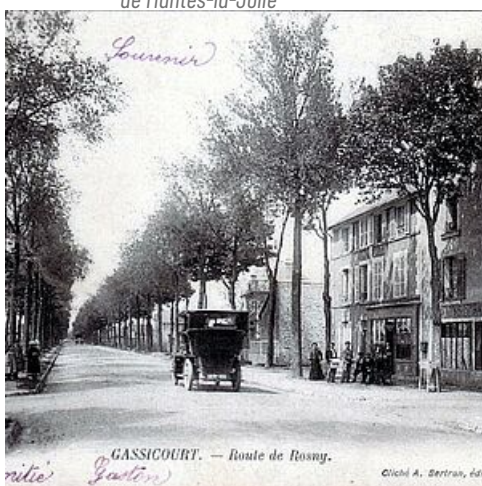
Route de Rosny, Gassicourt