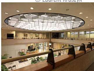
Hall de l'Hôtel de Ville