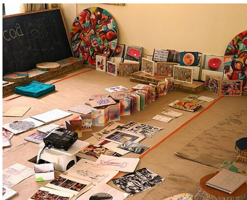
photo de la salle du coâ

Dans la salle des matières, dessin, peinture et modelage sont proposés en expression libre. L'atelier assembl'art ouvre à la pratique des techniques mixtes et des réalisations collectives. En parallèle, la pratique de la photographie permet d'alimenter un dossier personnel. Les réalisations sont commentées dans la salle du coâ pour travailler sur la place du regard. La finalité est de constituer pour chacun des participants un dossier qui témoigne de la variété des identités visuelles et plastiques.