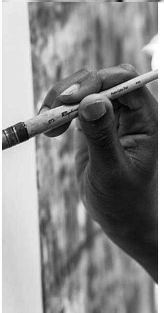
Inspiration, travail photographique de Caroline Boucard dans la salle des matières, 2017