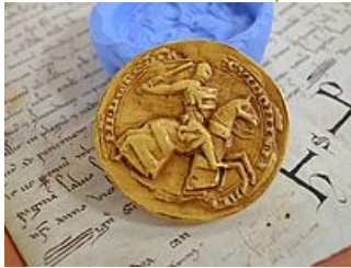
Atelier de sigillographie « Le sceau du roi », AM Mantes-la-Jolie)