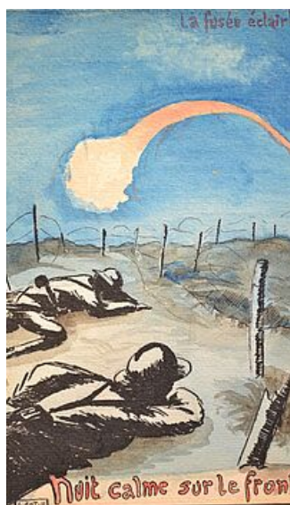
Nuit calme sur le front, 12 novembre 1917, AM Mantes-la-Jolie, 1 DN 85 fonds Louis Got

L'histoire d'une ville et de ses habitants s'écrit aussi grâce aux documents d'origine privée comme les archives des associations ou des familles. Vous êtes propriétaire de documents qui vous semblent utiles pour témoigner de l'histoire mantaise et souhaitez qu'ils soient préservés et qu'ils deviennent accessibles aux chercheurs ? N'hésitez pas à contacter le service.