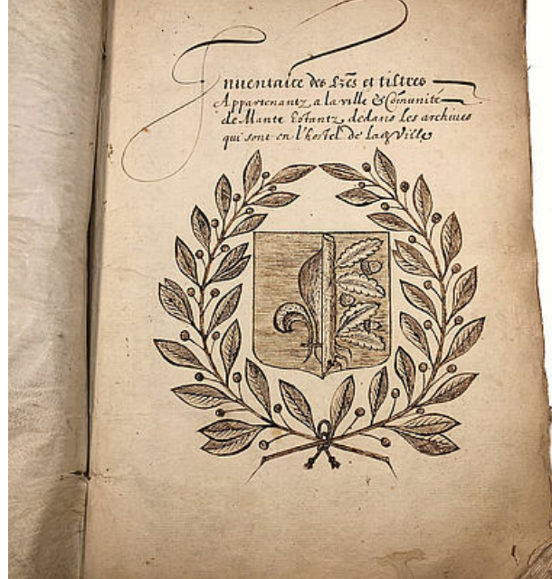
Page de garde de l'inventaire des archives avec les armoiries de la ville, 1543, AM Mantes-la-Jolie, II Annexe 32