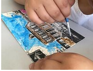
Atelier colorisation de carte postale « Bonjour de Mantes »