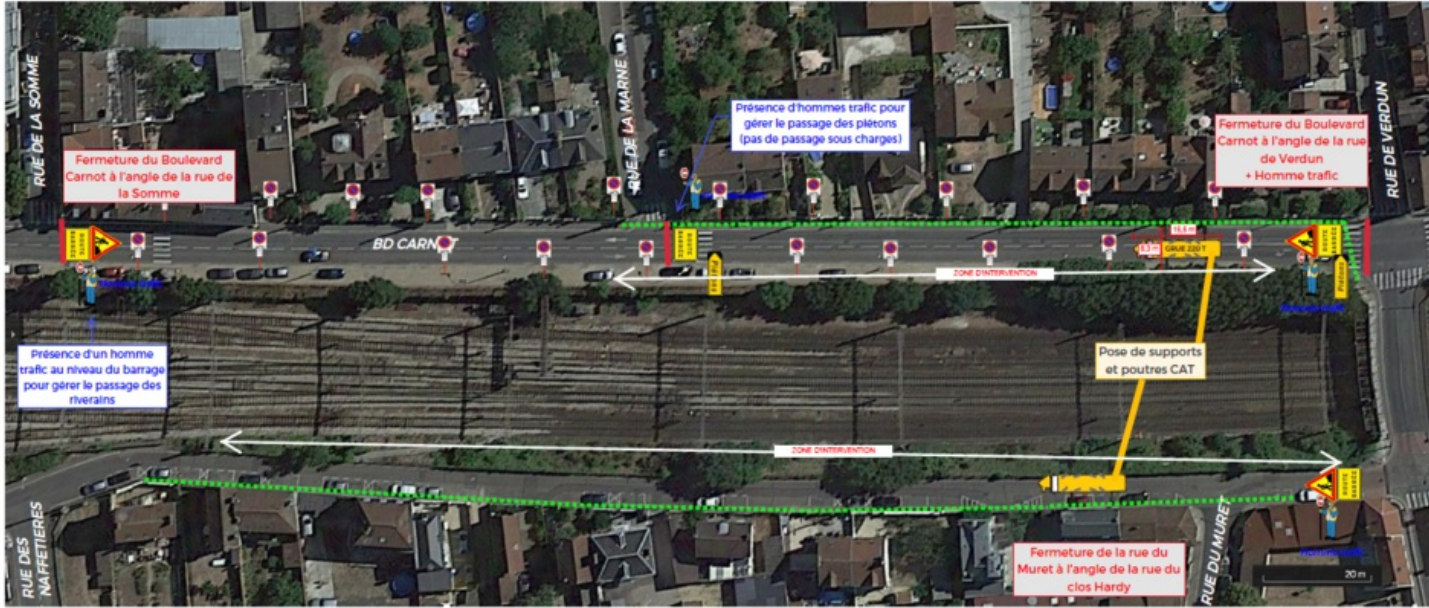
Semaine 8 - Dimanche 25 février - Bld Calmette