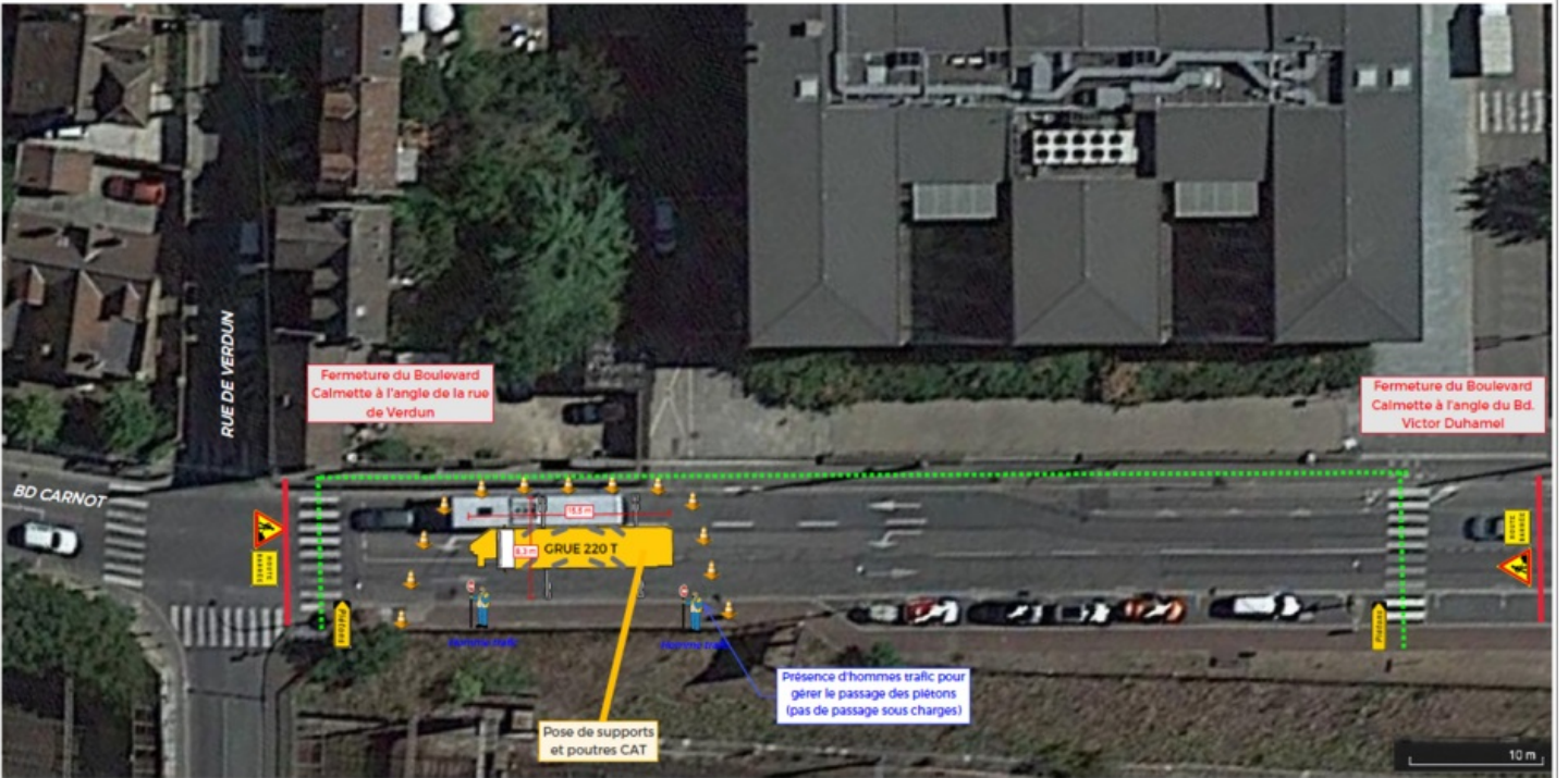
Plan de déviation - Levage Bld Calmette - Dimanche 25 février 2024