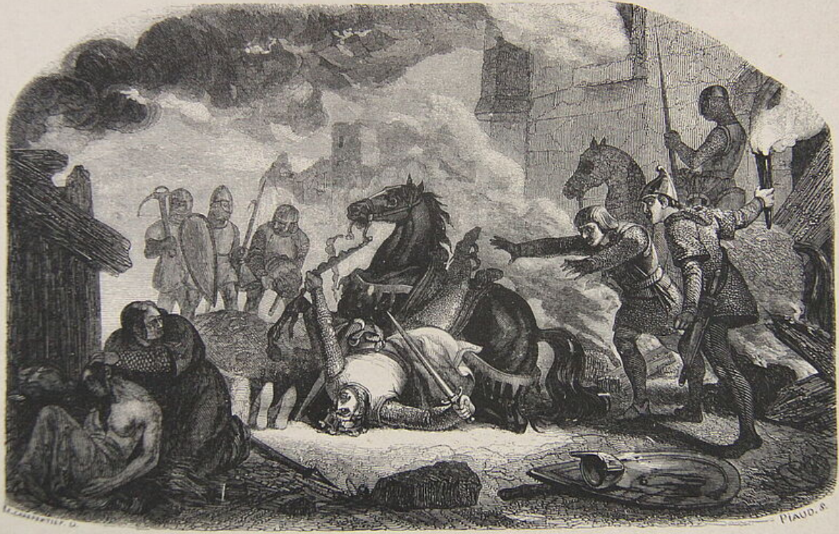
Le Roi Guillaume blessé en incendiant la Ville de Mantes.