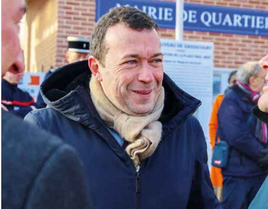
Raphaël Cognet Maire de Mantes-la-Jolie

Parce que le vivre-ensemble est essentiel pour le bien-être de tous