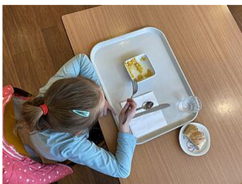
CP Organisation Restauration scolaire