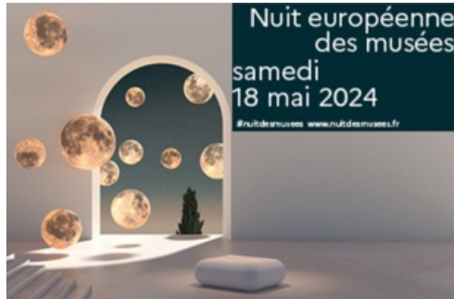
CP Nuit Européenne des Musées 2024