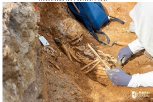
CP sur les fouilles archéologiques au centre-ville 2023