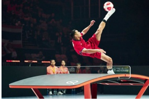
CP Urban Teqball Challenge