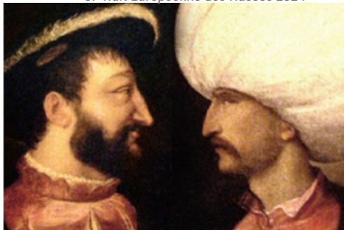
CP Exposition Les musulmans dans l'histoire de France