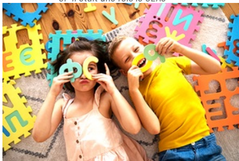
CP Ouverture de la ludothèque Chopin aux 6-13 ans