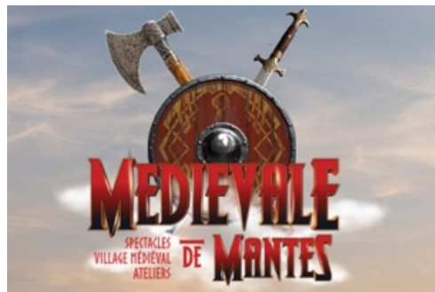
CP La Foire aux Oignons présente la Médiévale de Mantes 2023