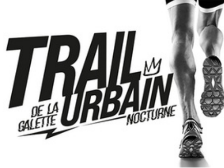
CP Trail de la Galette - 2025