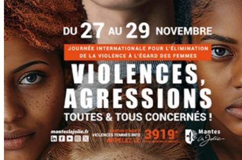
CP - Journée Internationale pour l'élimination de la violence à l'égard des Femmes