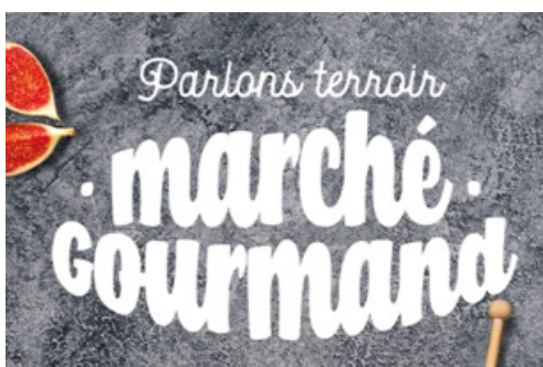
CP Parlons Terroir - Marché Gourmand - 2022