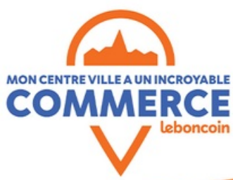
DP Mon Centre-Ville a Un Incroyable Commerce II 2024