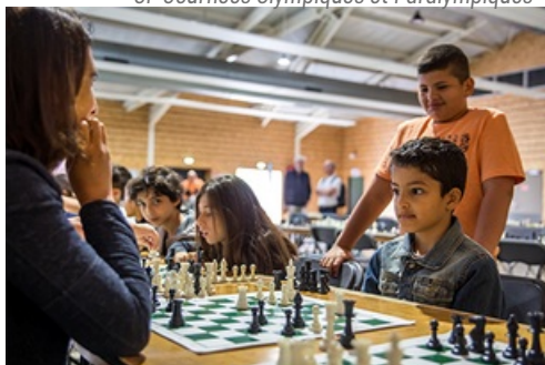
CP Tournoi d'Échecs