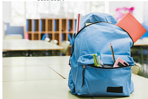
CP Rentrée 2022