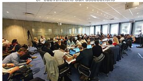
Dossier de presse du Conseil Municipal - 7 juin 2022