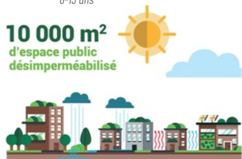
CP Projet Oasis