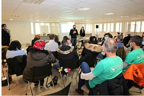
CP Bilan Assises Transition Ecologique