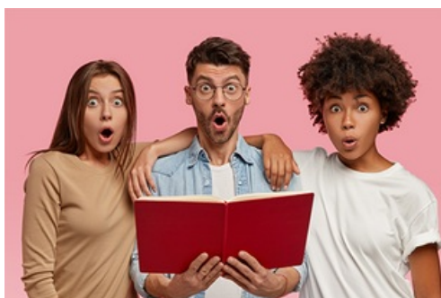
CP Mantes-la-Jolie - Nouvelle politique culturelle, nouvelle programmation