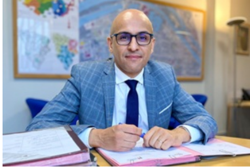
CP Election Présidentielle communiqué du Maire par intérim