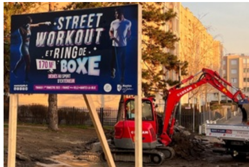
CP Nouveau Street Workout "Oumar N'Diaye"