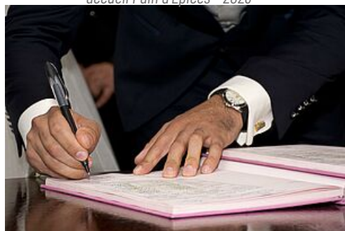
Charte de déontologie et d'éthique des élus du conseil municipal pour la moralisation de la vie politique locale - 7 juin 2022