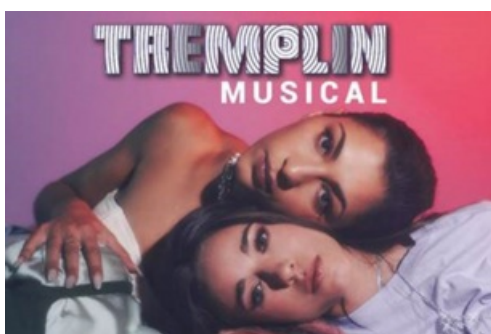
CP Tremplin Musical 2023