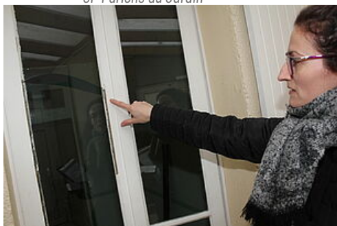
CP Permis de louer