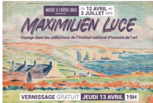
Dossier de Presse Exposition Maximilien Luce - Voyage dans les collections de l'INHA