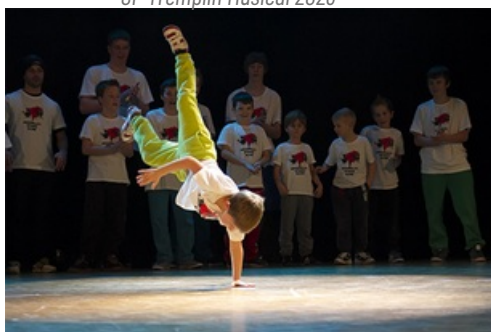
CP Battle Breakdance Collèges de Mantes 2023