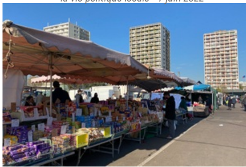
CP Affaire des marchés forains