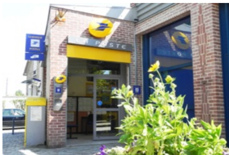
CP La Poste Quartier de Gassicourt