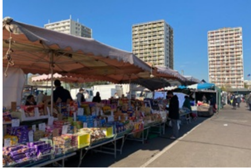
CP Affaire des marchés forains