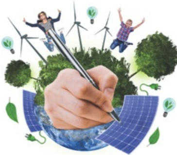
CP Dictée Mantaise