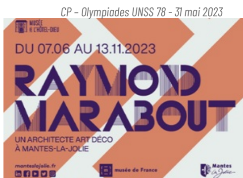
Dossier de Presse exposition Raymond Marabout