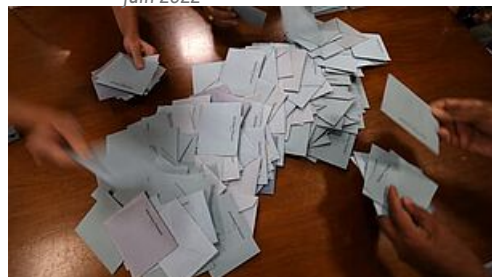
CP Election Municipale 1er tour