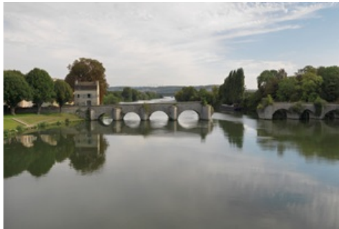
Dossier de presse exposition Terres de Seine 2022