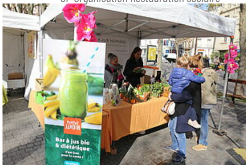
CP Parlons du Jardin