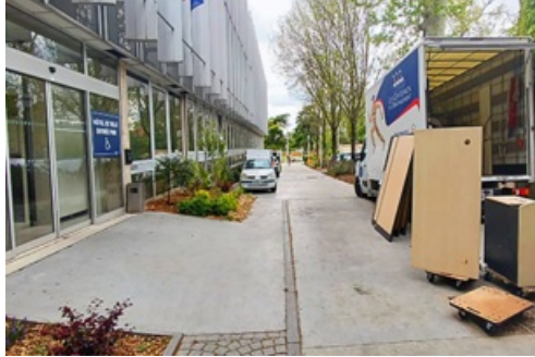
CP Travaux de modernisation pour l'Hôtel de Ville