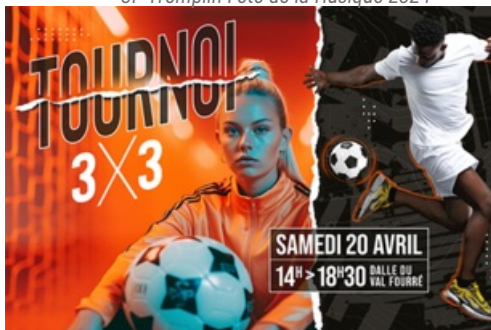
CP S3 Tournoi Foot Freestyle 2024