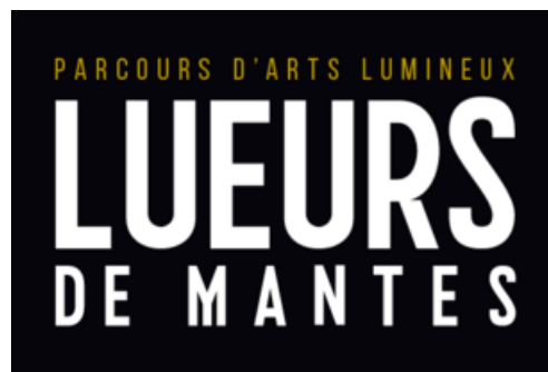
CP Lueurs de Mantes 2024-2025