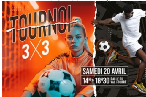
CP S3 Tournoi Foot Freestyle 2024