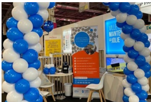
CP Mantes Franchise Expo