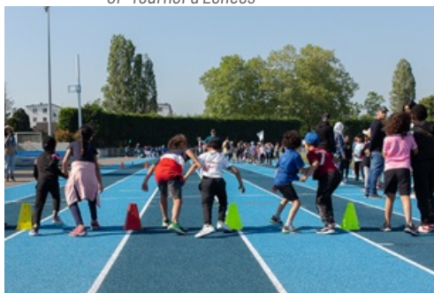
CP - Yvelines Olympiades - juin 2023