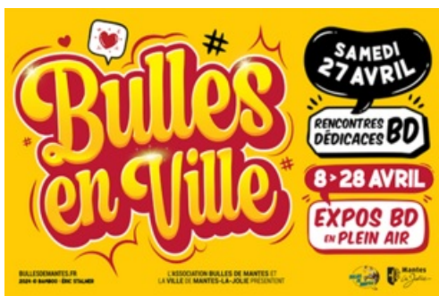
CP Bulles en Ville 2024