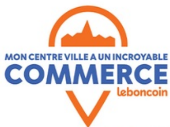
DP Mon Centre-Ville a Un Incroyable Commerce II 2024