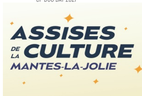
CP Lancement des Assises de la Culture