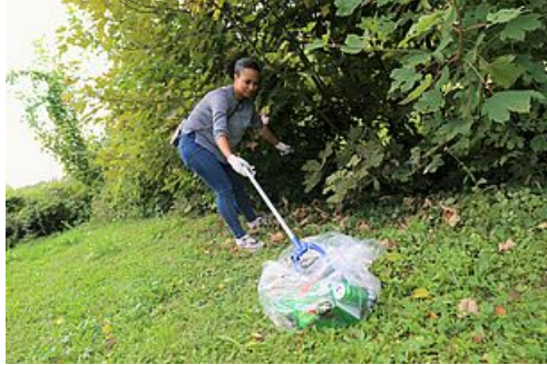
CP ramassage des déchets