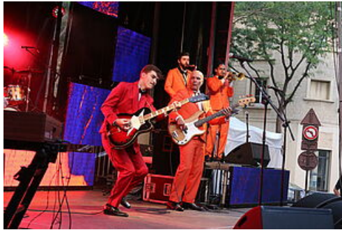
CP Annulations d'évènements