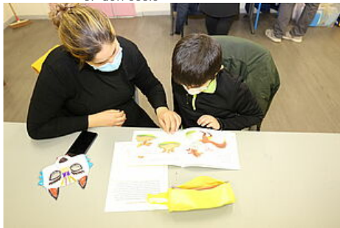
CP Hiver apprenant