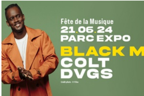
CP Fête de la Musique - Black M - 2024