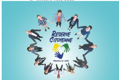
CP Réserve citoyenne