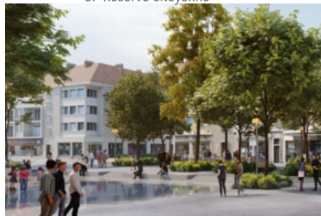
CP Travaux Places du Coeur