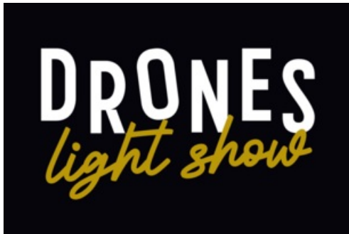
CP Drones Light Show