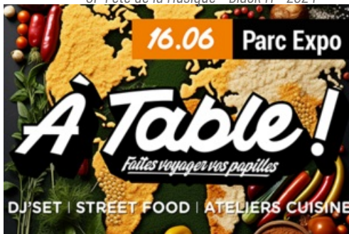
CP - À Table