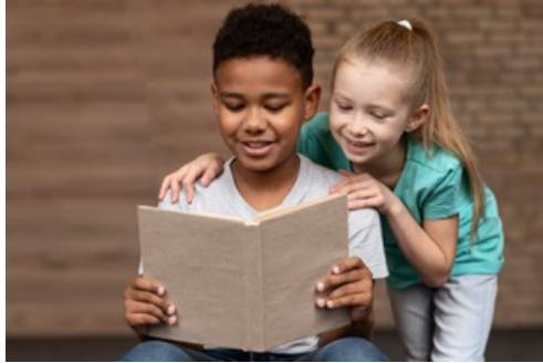
CP Il était une fois le CLAS