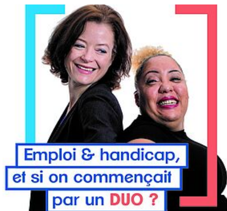
CP DUO DAY 2021