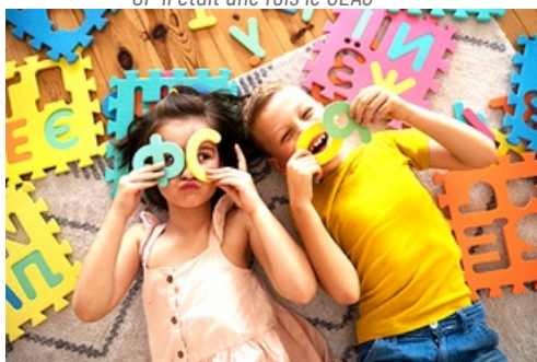
CP Ouverture de la ludothèque Chopin aux 6-13 ans