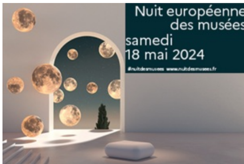
CP Nuit Européenne des Musées 2024