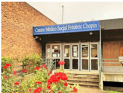
CP Écoute psychologique