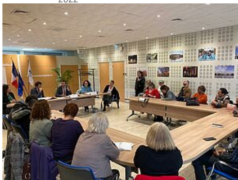
CP Projet territorial d'accueil et d'intégration