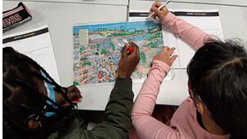
CP défi école