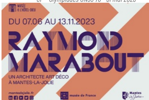
Dossier de Presse exposition Raymond Marabout