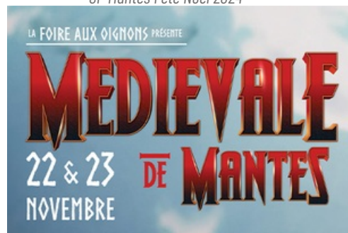
CP Médiévale de Mantes 2024