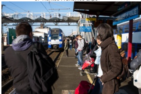
CP Suppression trains normands