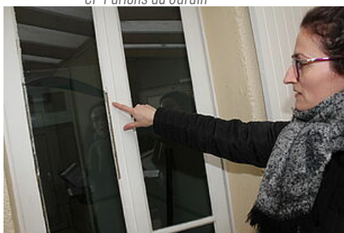
CP Permis de louer