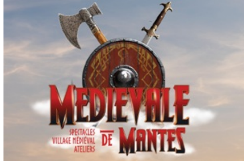
CP La Foire aux Oignons présente la Médiévale de Mantes 2023