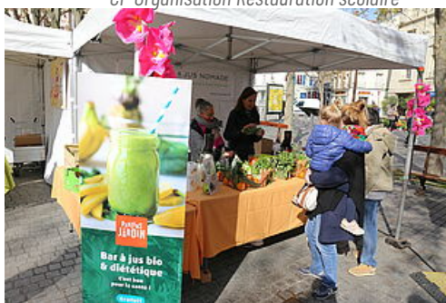
CP Parlons du Jardin