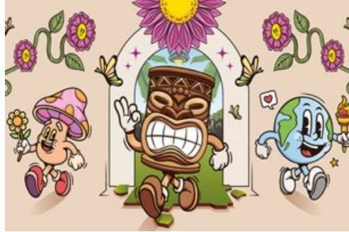
CP Festival 6ème Monde 2024