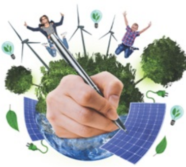
CP Dictée Mantaise