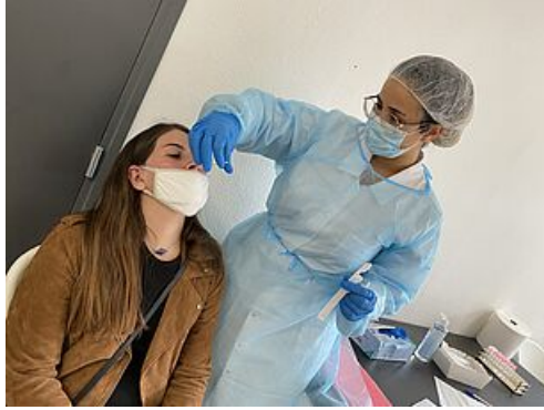
CP test antigénique