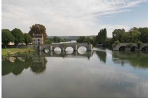
Dossier de presse exposition Terres de Seine 2022