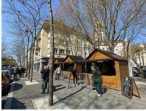
CP Village Restaurateurs