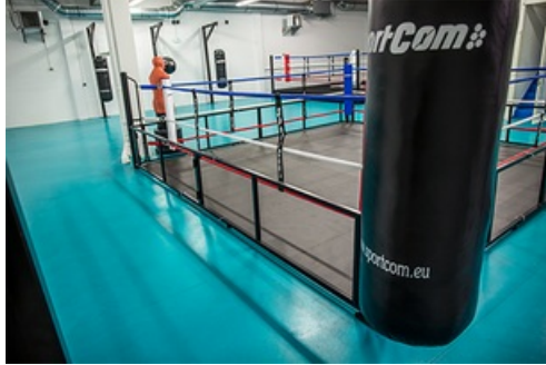
CP Inauguration Complexe sportif Haby Niaré