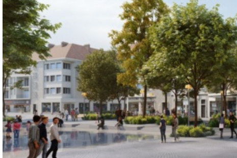
CP Travaux Places du Coeur