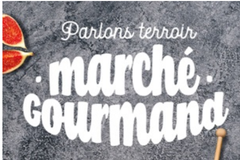
CP Parlons Terroir - Marché Gourmand - 2022