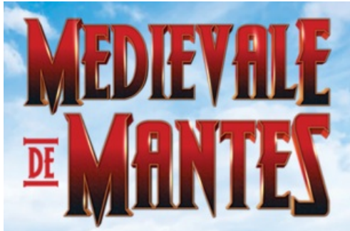
CP Foire aux Oignons - Médiévale de Mantes 2022