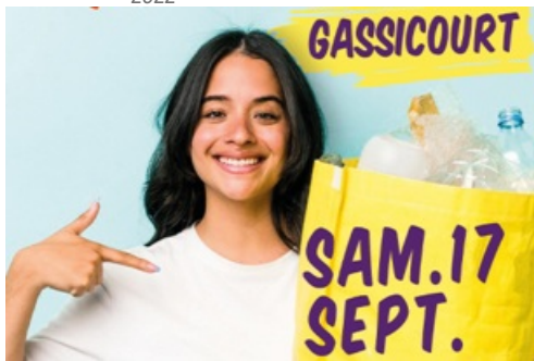
CP Opération "Coup de poing propreté" à Gassicourt