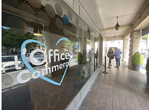
CP Office du commerce