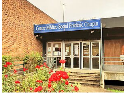
CP Écoute psychologique