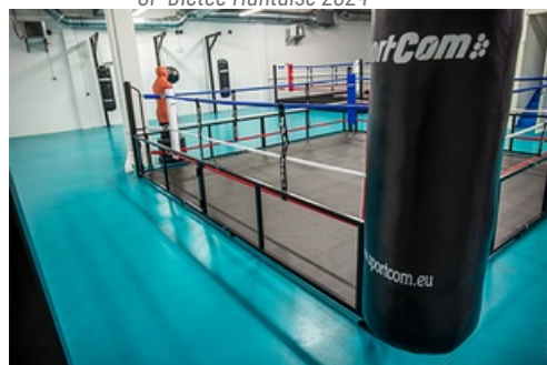
CP Inauguration Complexe sportif Haby Niaré