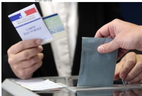
CP Election Présidentielle 2e tour