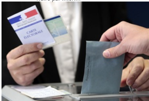
CP Élection Présidentielle 1er tour