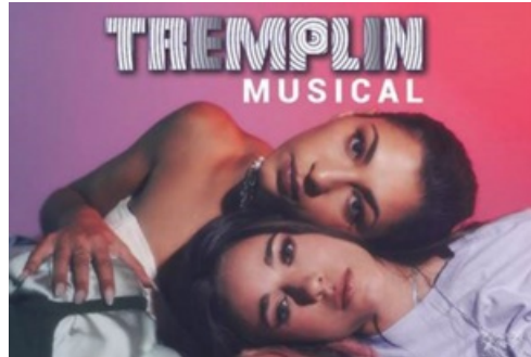
CP Tremplin Musical 2023