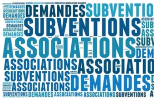
CP Subventions aux associations