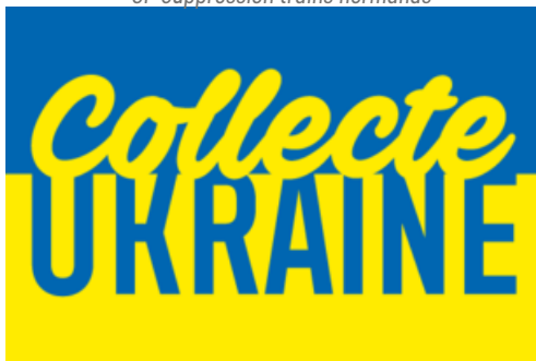
CP Dons Ukraine