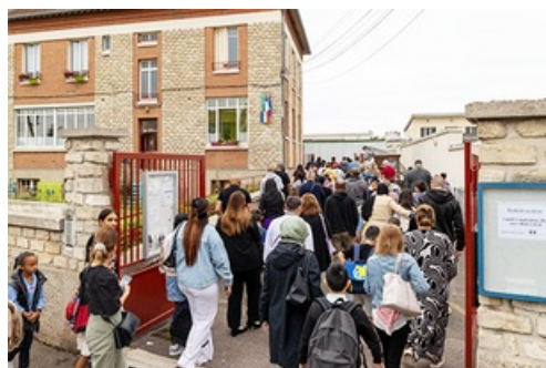
CP Rentrée scolaire 2024