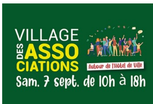
CP Village des Associations 2024