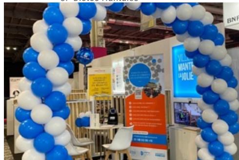
CP Salon Franchise Expo 2023