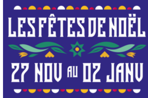
CP NOËL 2021