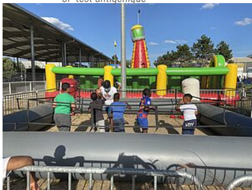
CP Un été de loisirs et d'éducation