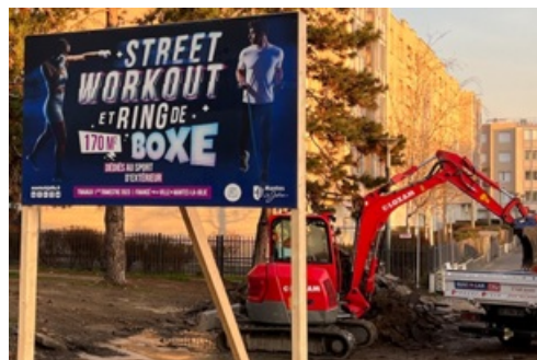
CP Nouveau Street Workout "Oumar N'Diaye"