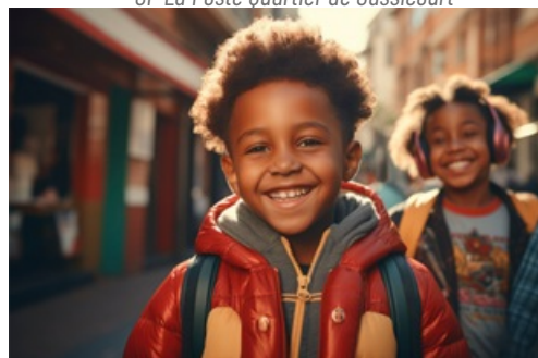
CP Tous en confiance avec le CLAS