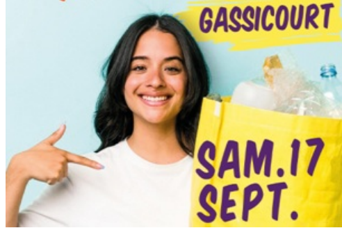
CP Opération "Coup de poing propreté" à Gassicourt