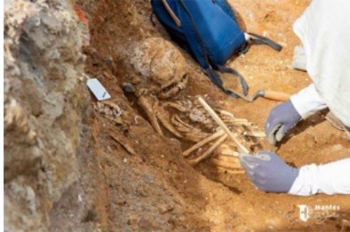
CP sur les fouilles archéologiques au centre-ville 2023