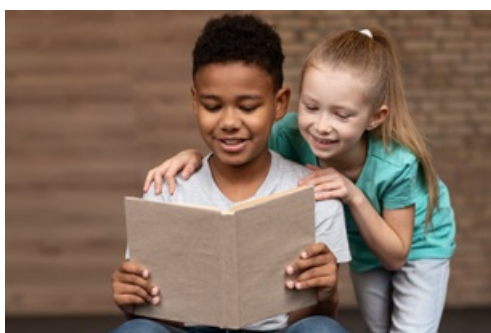
CP Il était une fois le CLAS