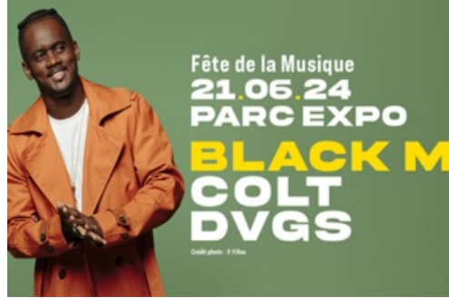
CP Fête de la Musique - Black M - 2024