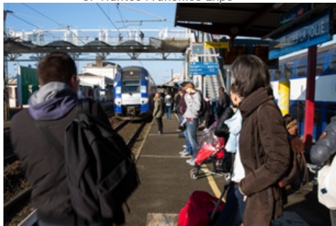
CP Suppression trains normands