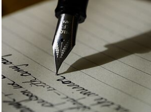
CP réaction du Maire - incidents