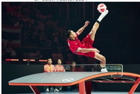
CP Urban Teqball Challenge