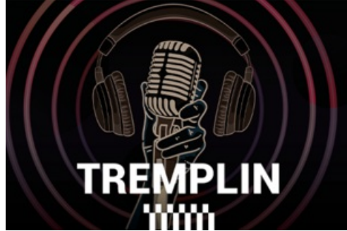
CP Tremplin Fête de la Musique 2024