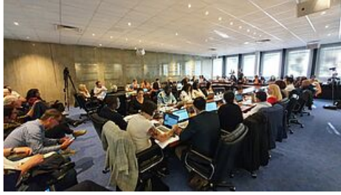
Dossier de presse du Conseil Municipal - 7 juin 2022