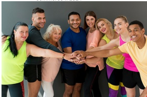
CP Rentrée sportive 2024