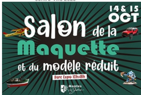
CP Salon de la maquette et du modèle réduit 2023