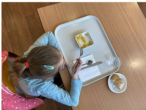
CP Organisation Restauration scolaire