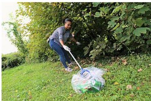
CP ramassage des dechets