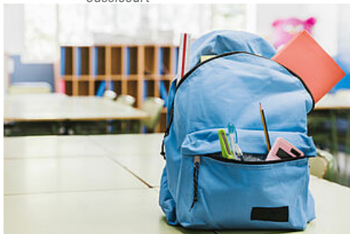
CP Rentrée 2022