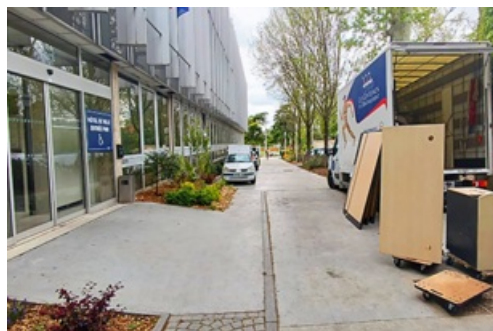
CP Travaux de modernisation pour l'Hôtel de Ville