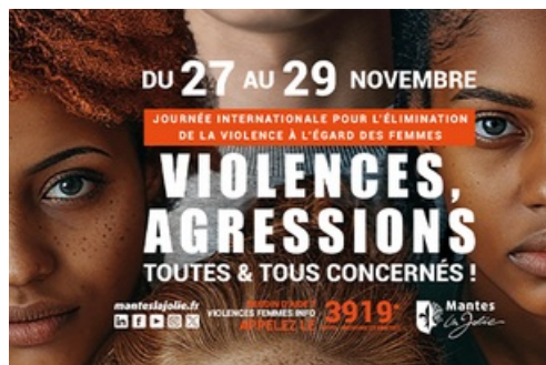
CP - Journée Internationale pour l'élimination de la violence à l'égard des Femmes