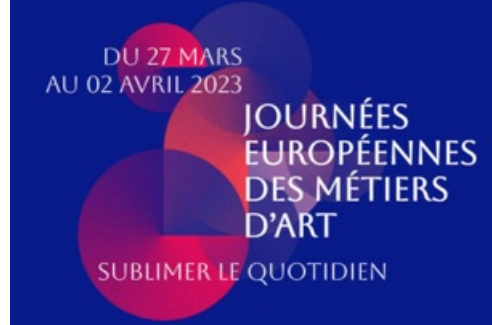
CP Journées Européennes des Métiers d'Art 2023