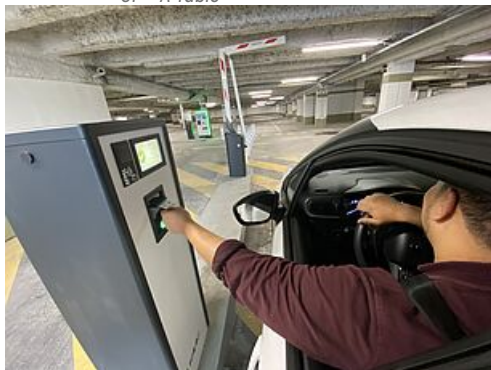
CP - Interparking - Indigo