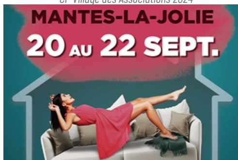
CP Salon Habitat 2024