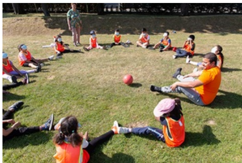
CP Journées Olympiques et Paralympiques