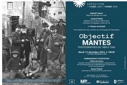
Dossier de presse exposition Objectif Mantes