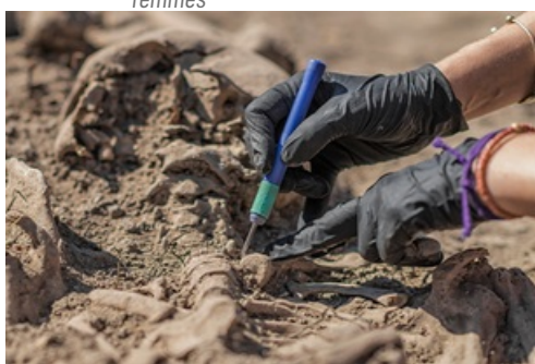
CP Diagnostic archéologique - Collégiale