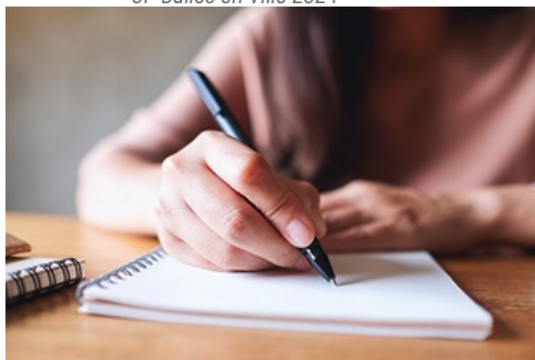
CP Dictée Mantaise 2024