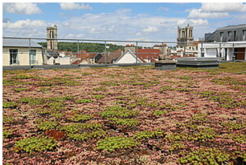
CP Assise de la transition écologique