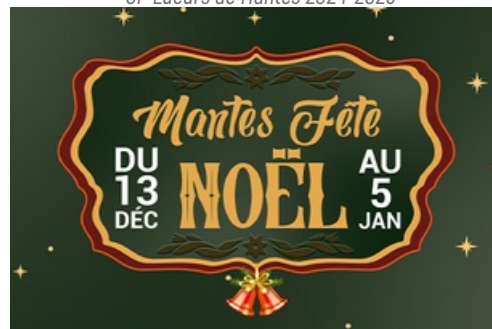
CP Mantes Fête Noël 2024