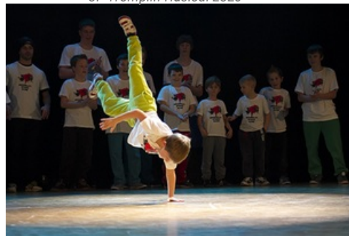
CP Battle Breakdance Collèges de Mantes 2023