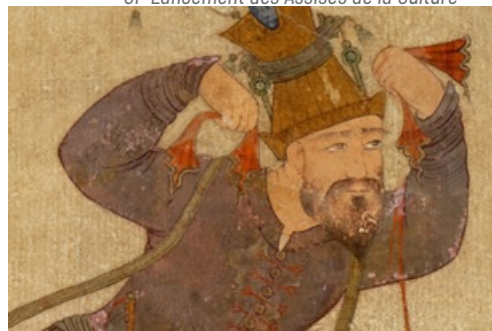
Dossier de presse Exposition Arts de l'Islam