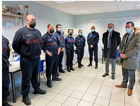
CP Réaction Maire Incendies Police Municipale