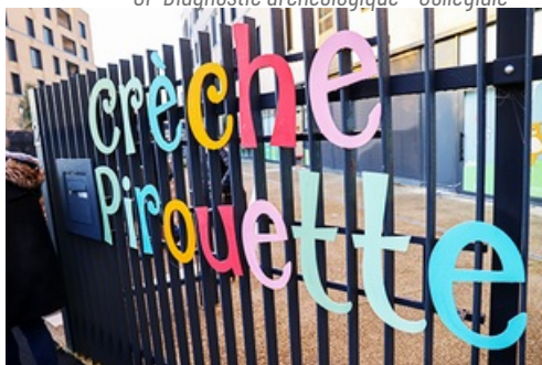
Dossier de presse crèche Pirouette