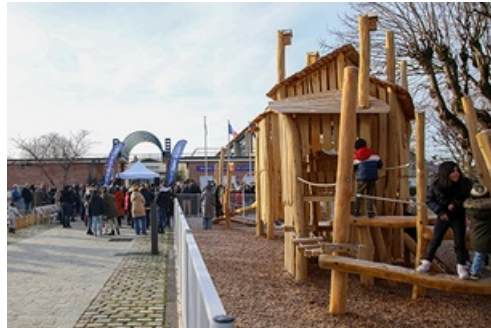
CP Inauguration - Maison France Services & Place Paul Bert