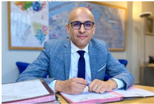
CP Election Présidentielle communiqué du Maire par intérim