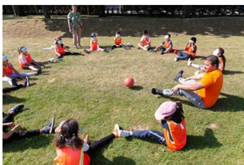
CP Journées Olympiques et Paralympiques