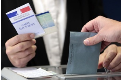
CP Élection Présidentielle 1er tour