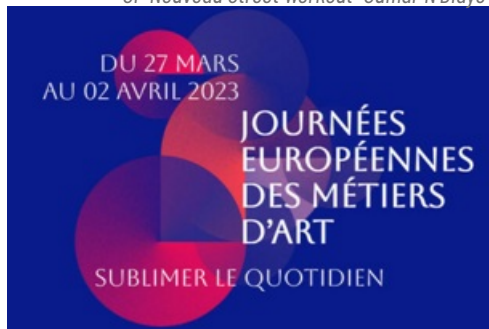
CP Journées Européennes des Métiers d'Art 2023