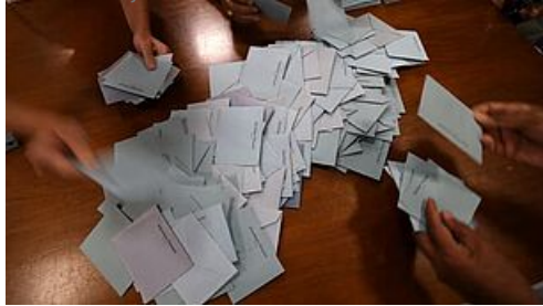
CP Election Municipale 1er tour