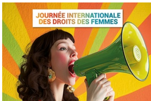
CP Journée internationale des droits des femmes