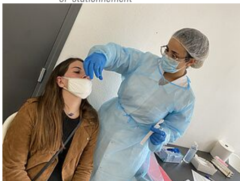
CP test antigénique