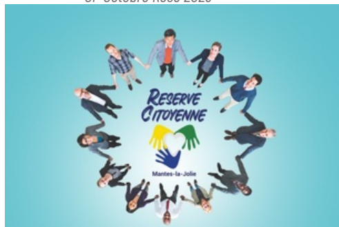
CP Réserve citoyenne