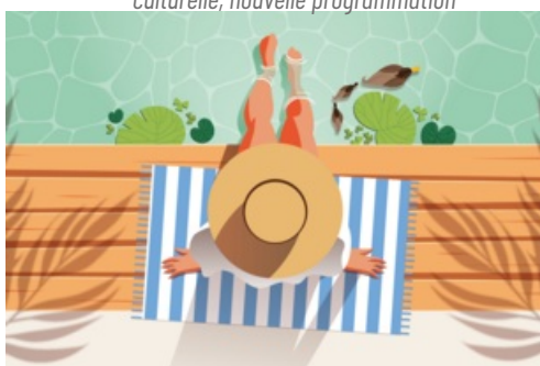
CP Un été à Mantes - 2023