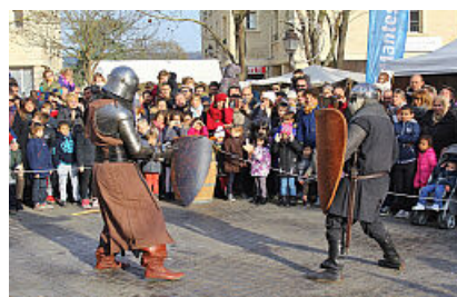
CP Foire aux Oignons 2021