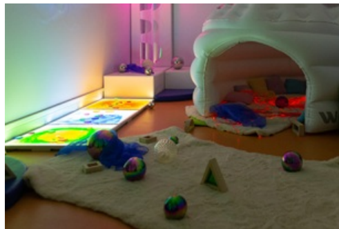
CP Inauguration - salle Snoezelen - Multi-accueil Pain d'Epices - 2023