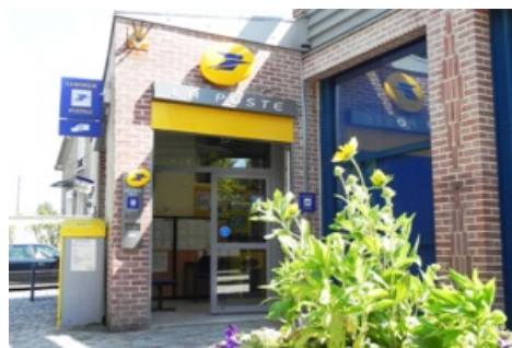
CP La Poste Quartier de Gassicourt