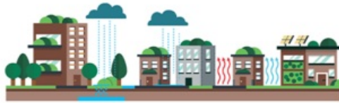
CP Projet Oasis