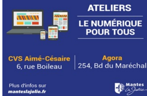
CP Le numérique pour tous