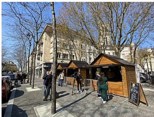
CP Village Restaurateurs