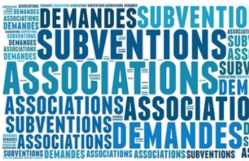
CP Subventions aux associations