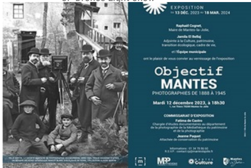
Dossier de presse exposition Objectif Mantes