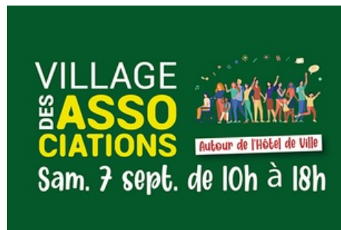
CP Village des Associations 2024