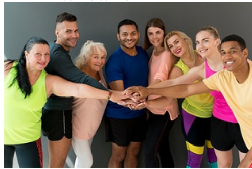
CP Rentrée sportive 2024