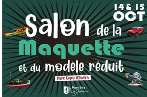
CP Salon de la maquette et du modèle réduit 2023