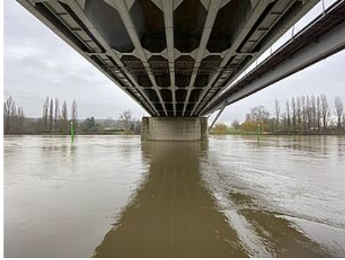
CP Crue de la Seine