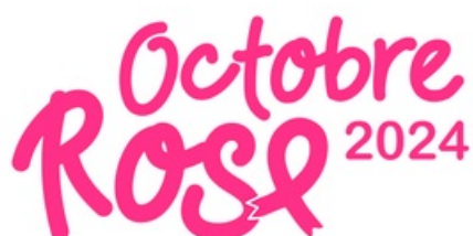
CP Octobre Rose 2024