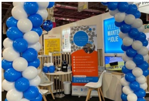
CP Mantes Franchise Expo