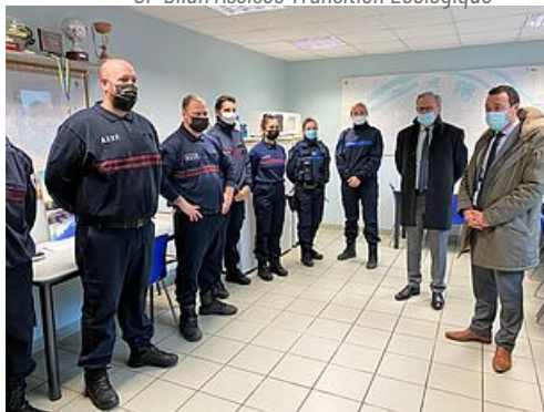
CP Réaction Maire Incendies Police Municipale