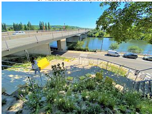
CP Belvédère fluvial