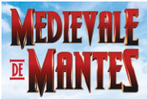
CP Foire aux Oignons - Médiévale de Mantes 2022