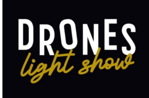
CP Drones Light Show