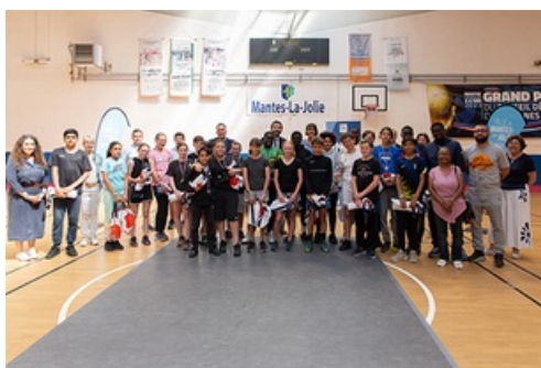
CP - Olympiades UNSS 78 - 31 mai 2023