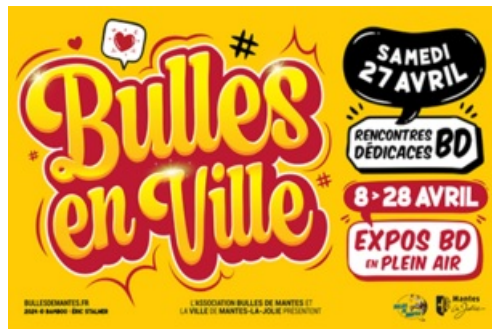
CP Bulles en Ville 2024