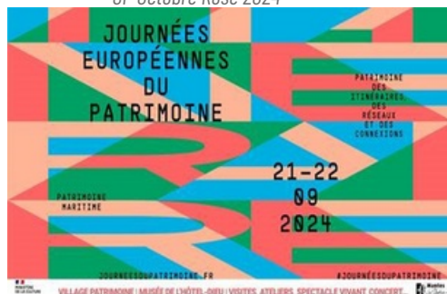
CP Journées Européennes du Patrimoine 2024