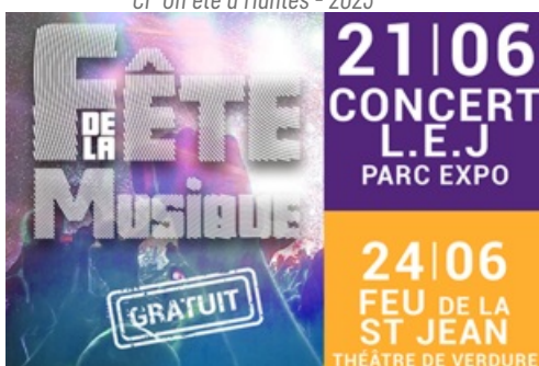
CP Fête de la Musique et Feux de la St Jean