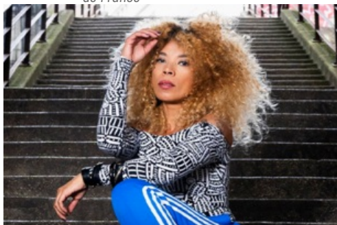
CP Concert de Flavia Coelho - Samedi 4 mai