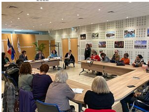
CP Projet territorial d'accueil et d'intégration