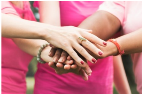
CP Octobre Rose 2023