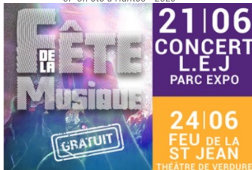
CP Fête de la Musique et Feux de la St Jean