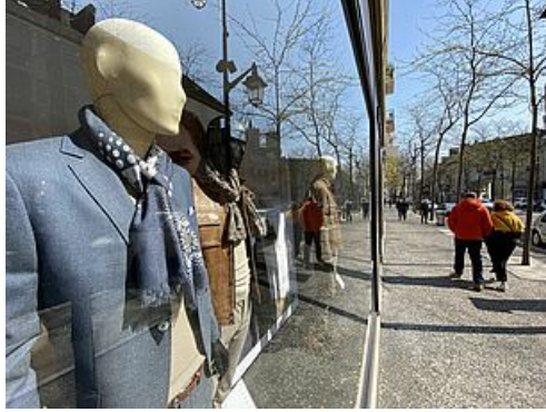
CP Action commerce