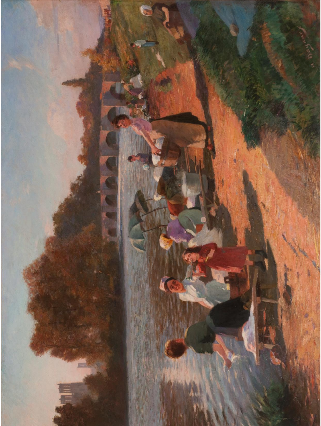
Albert Dagnaux, Les Lavandières , 1906, Huile sur toile. Don Jeanne Paquin, Musée de l'Hôtel Dieu, Mantes-la-Jolie.