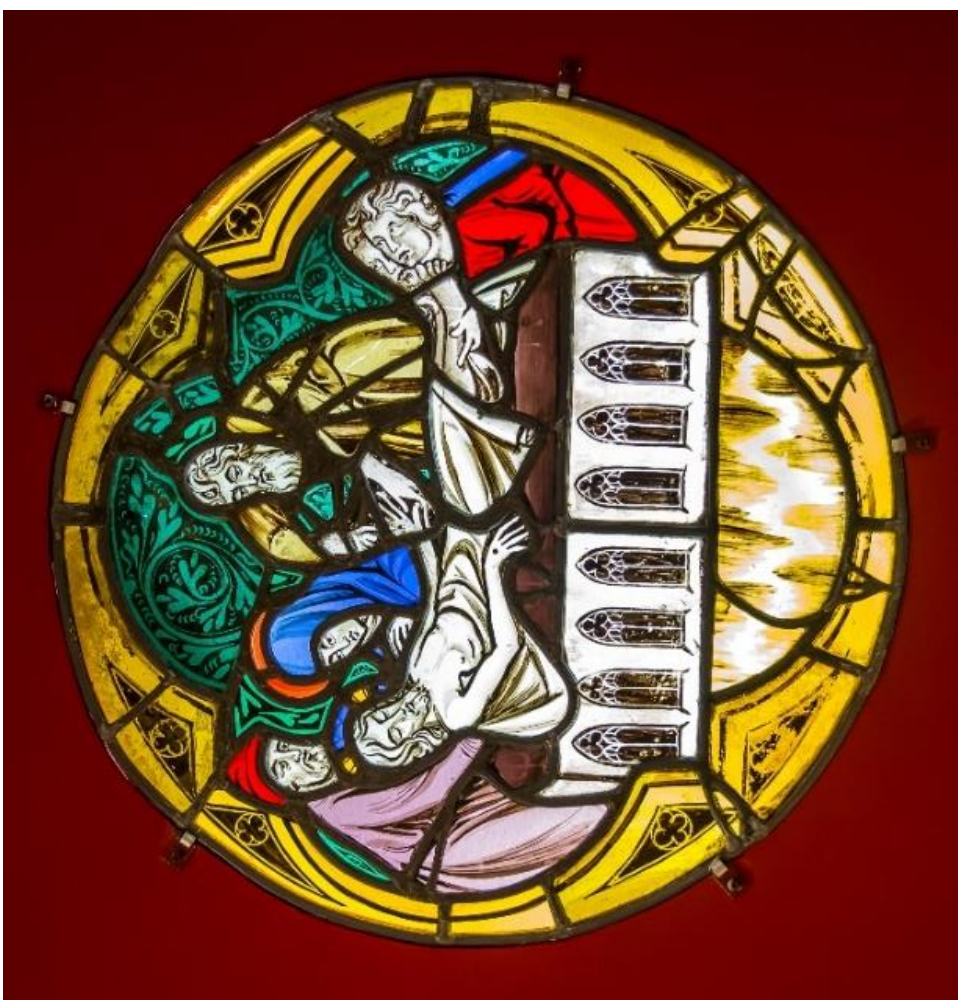
Mise au tombeau