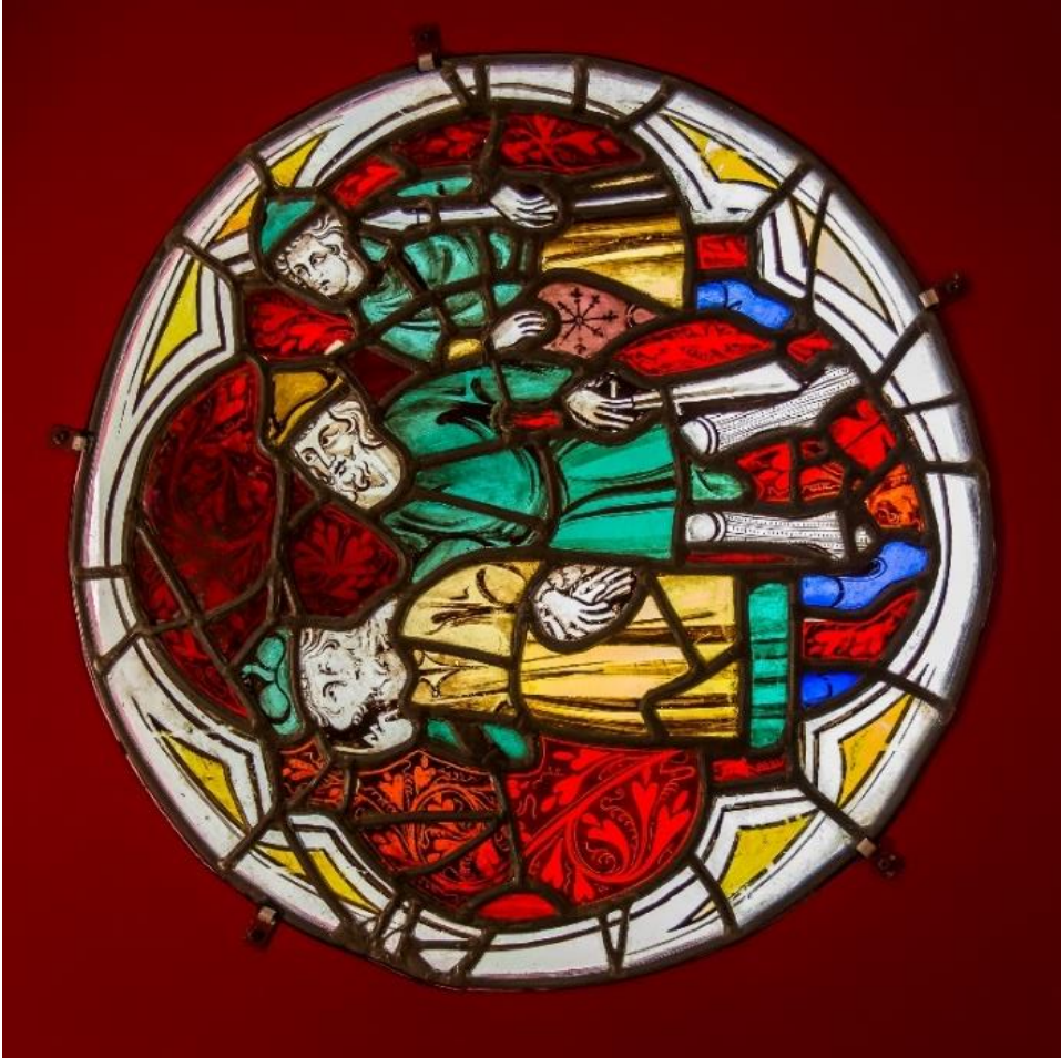
Centurion et deux soldats