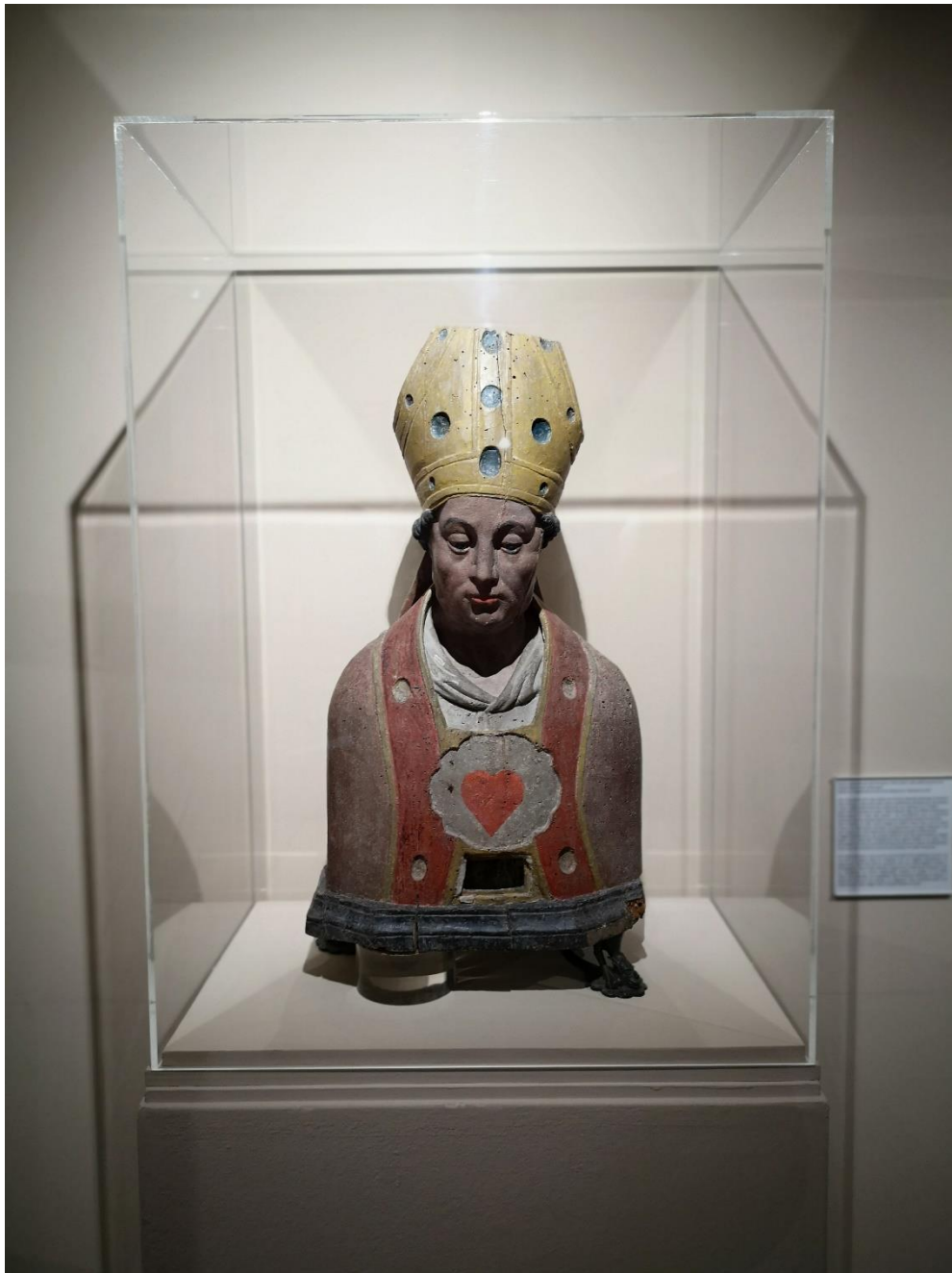
Buste reliquaire de Saint-Sulpice, XVIIe siècle, bois taillé polychrome. Classé Monument Historique. Dépôt de l'Eglise Sainte-Anne de Gassicourt, Mantes-la-Jolie.