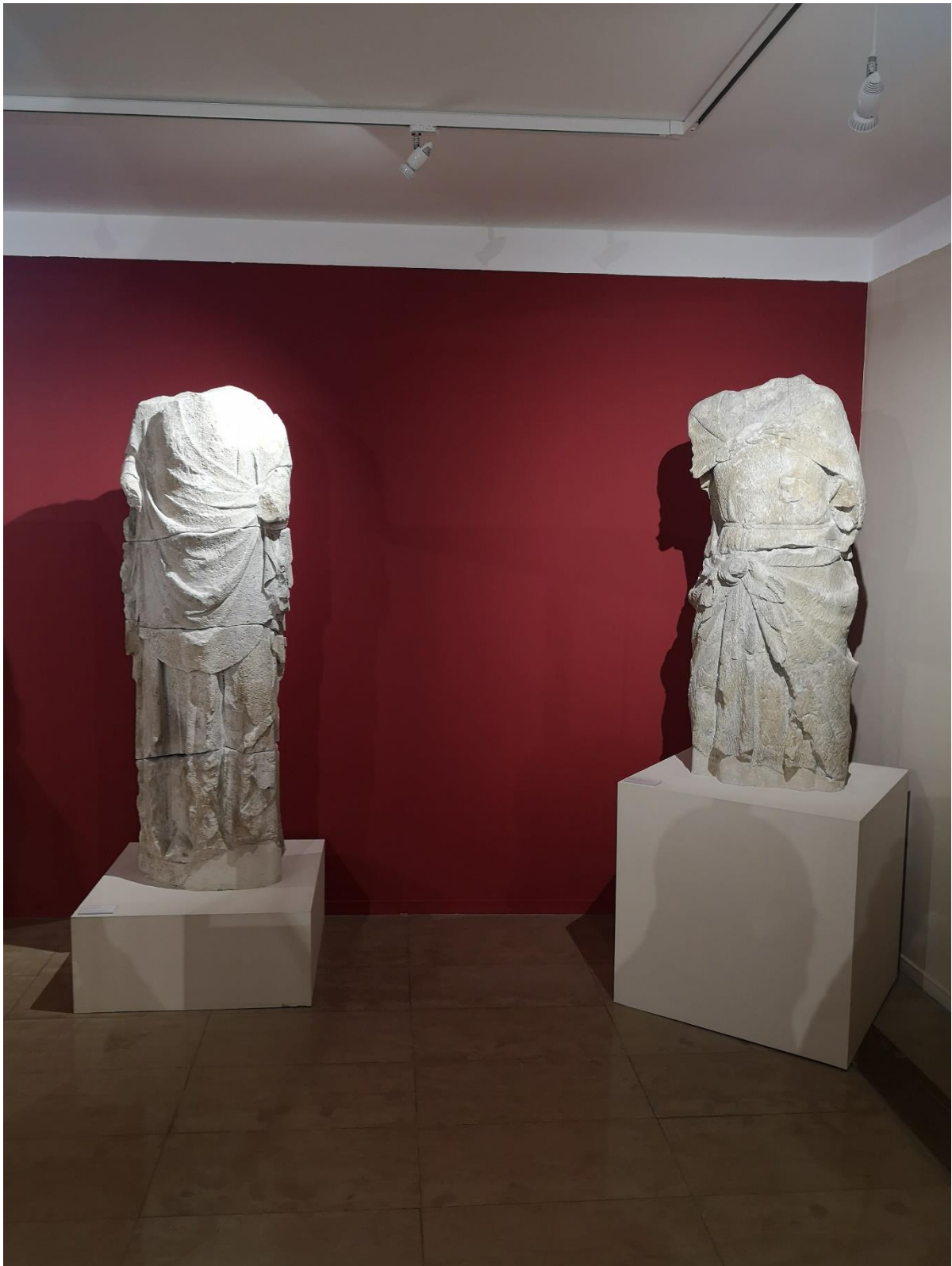
La statuaire du portail des Échevins, vers 1320, pierre calcaire.