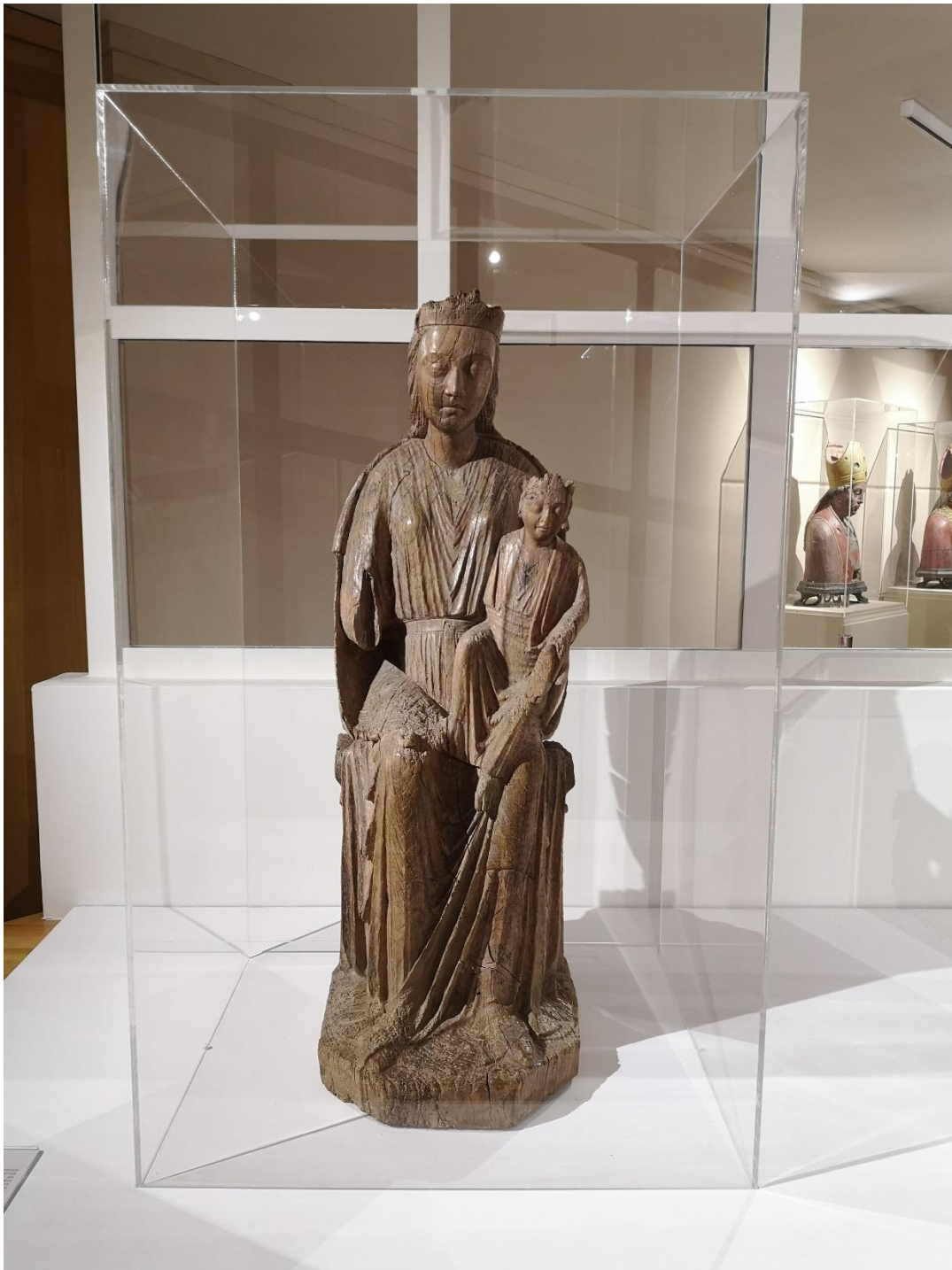
Vierge à l'Enfant , début du XIIIe, chêne. Classé Monument Historique. Dépôt de l'Eglise Sainte-Anne de Gassicourt, Mantes-la-Jolie.