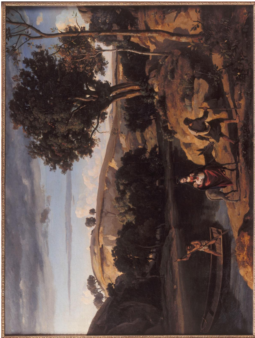
Jean-Baptiste Camille Corot (1796-1878), La fuite en Egypte , 1840, Huile sur toile. Dépôt de la Ville de Rosny-sur-Seine, 2018.