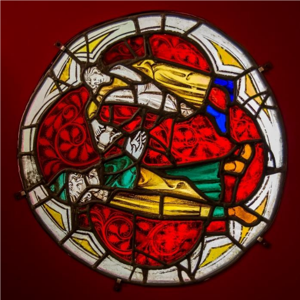
Pilate se lave les mains